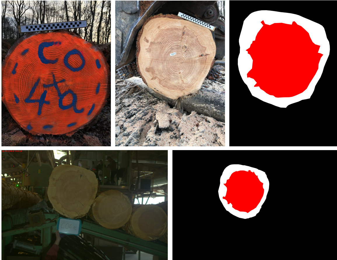
FIGURE 3 – Exemples d'images du billon de Douglas C04a. En haut sur le parc à grume avec de gauche à droite le fin bout peint pour faciliter le repositionnement des planches, le gros bout tenu par une tête de tronçonnage et l'image segmentée manuellement de la section. En bas : gros bout vu depuis une caméra installée sur la chaîne de sciage et image segmentée de la section. Sur les images segmentées l'aubier est en blanc et le duramen en rouge.

de La Machine) a accepté d'équiper sa chaîne d'amenage d'une caméra et de réaliser l'expérience de sciage pour la collecte des planches. Après des essais de prises d'images sur un site d'exploitation puis suivi des billons jusqu'au parc de la scierie, nous avons décidé de prélever plutôt les grumes sur parc en sélectionnant quatre sites d'exploitation. Treize grumes (12-13 m) ont été choisies dans chaque site. Après billonnage, 156 billons de 3,5 à 4 m ont été obtenus. Des rondelles ont été prélevées entre chaque billons. Les billons ont été photographiés sur le parc avec un smartphone puis avec la caméra de la chaîne d'amenage, et enfin sciés (à l'exception de 4 billons qui ont servi à des essais de déroulage). Les produits du sciage ont été collectés sur 32 billons (4 sites \times 4 arbres \times 2 billons). Les 346 planches ont ensuite été acheminées à Cluny pour être testées par une machine d'essai puis par des essais en flexion statique jusqu'à la rupture. La Fig. 3 illustre cette campagne. La Fig. 4 illustre le repositionnement des planches dans leur billon d'origine.