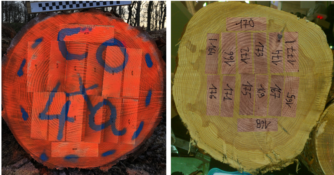
FIGURE 4 – Repositionnement des planches sur les images de sections du Douglas C04a. A gauche : fin bout sur le parc à grume. A droite : gros bout sur la chaîne de sciage.