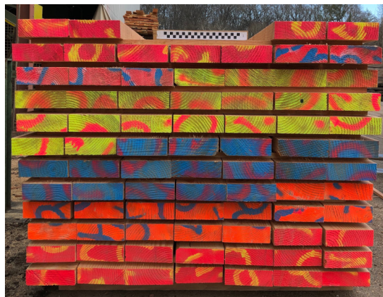
FIGURE 5 – Pile de planches obtenues pendant la campagne industrielle de sciage.

Pour faire le lien entre d'une part les caractéristiques mesurées sur les images prises en bout des billons (ou, dans le cadre du projet, les propriétés du bois mesurées sur des rondelles) et d'autre part les propriétés des sciages, il est utile de déterminer la position initiale des sciages dans la grume. Pour les 346 planches de Douglas analysées dans le cadre du projet, ce travail a été réalisé manuellement en se basant sur le dessin des cernes. Il s'agit cependant d'un travail difficile qui demande beaucoup de patience et de minutie. Dans l'idée que d'autres expériences similaires seront réalisées dans l'avenir, des outils ont été réalisés pour d'une part extraire les images des bouts de planches dans une pile (Fig. 5), et d'autre part pour replacer ces images dans l'image de la grume (Fig. 4) [22]. Ces travaux se poursuivent actuellement dans le cadre du projet ANR EffiQuAss.