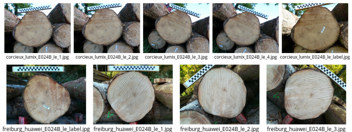
FIGURE 1 – Exemples d'images du billon d'épicéa E024B. En haut sur le site d'exploitation, en bas au FVA à Freiburg. Dans chaque cas plusieurs images ont été prises en faisant varier l'angle d'inclinaison de l'appareil.

La campagne « épicéa » a été menée en étroite collaboration avec les partenaires autrichiens du projet en septembre 2018. Elle a concerné 100 billons de 4,5 m de long prélevés dans les Vosges. Des images en bout des billons ont été prises en forêt, puis les billons ont été acheminés à Freiburg pour de nouvelles prises de photos des sections après transport. La Fig. 1 montre des images de sections transversales prises lors de cette campagne sur le site d'exploitation puis à Freiburg. Dans le but de tester les algorithmes de reconnaissance des billons, plusieurs photos ont été prises de chaque section en faisant varier l'angle d'inclinaison de l'appareil. Les billons ont ensuite été scannés par un tomographe industriel à rayons X à l'Institut de recherche forestière du Baden-Württemberg (FVA) (Fig. 2 droite). Un LiDAR terrestre a aussi été utilisé pour recueillir des informations sur la forme tridimensionnelle des billons en complément des informations disponibles sur les sections pour évaluer la qualité (Fig. 2 gauche). Des rondelles ont été découpées aux deux extrémités de chaque billon pour être analysées avec des caméras hyperspectrales (Fig. 2 milieu) puis permettre les mesures de qualité au laboratoire (densité du bois et largeurs de cernes).