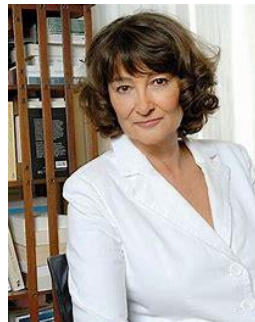
Lionel Jospin, 1 er Ministre de la France 1997-2002 Sylviane Agacinski, Philosophe

Invité par René Girard, Derrida participe en 1966 à l'université Johns Hopkins de Baltimore à un colloque resté fameux pour avoir lancé la French Theory aux États-Unis, où elle allait trouver un développement considérable. La vie de Derrida bascule et devient publique à partir de 1967-1968, et la publication de plusieurs ouvrages importants ( L'Écriture et la Différence , De la Grammatologie ) et de sa conférence sur « La Différance ». C'est certainement le philosophe le plus célèbre dans le monde à la fin du XX ème siècle. Pourtant, lors de sa mort le 9 octobre 2004 d'un cancer au pancréas diagnostiqué un an auparavant, la France ne lui rend pas vraiment l'hommage national auquel on aurait pu s'attendre. La nouvelle ne passe pas à proprement parler inaperçue, mais elle ne prend pas de véritable résonance populaire, ni même médiatique, sans doute parce que Derrida, sur aucun point, n'a jamais adopté les positions tranchées qui rendent visibles ceux qui les défendent.