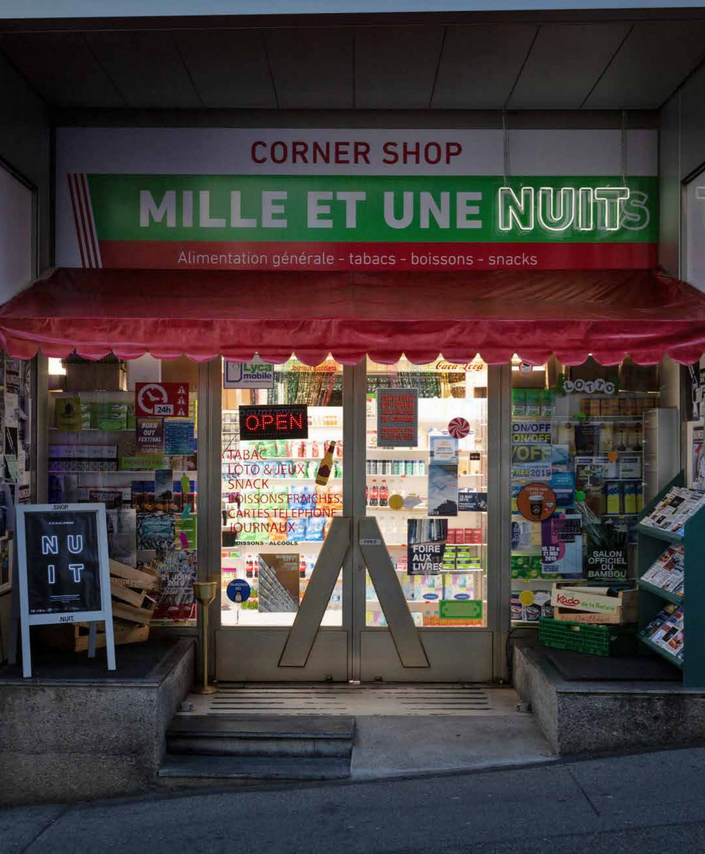
FIGURE1 Scènes de Nuit . Nocturnal Exhibition at f'ar Lausanne, 2019. Curators: Javier F. Contreras, Youri Kravtchenko; Assistant: Manon Portera; Scenography: students HEAD — Genève.

FIGURA1 Scènes de Nuit . Exposición nocturna en f'ar Lausanne, 2019. Curadores: Javier F. Contreras, Youri Kravtchenko; Asistente: Manon Portera; Escenografía: estudiantes HEAD — Genève.