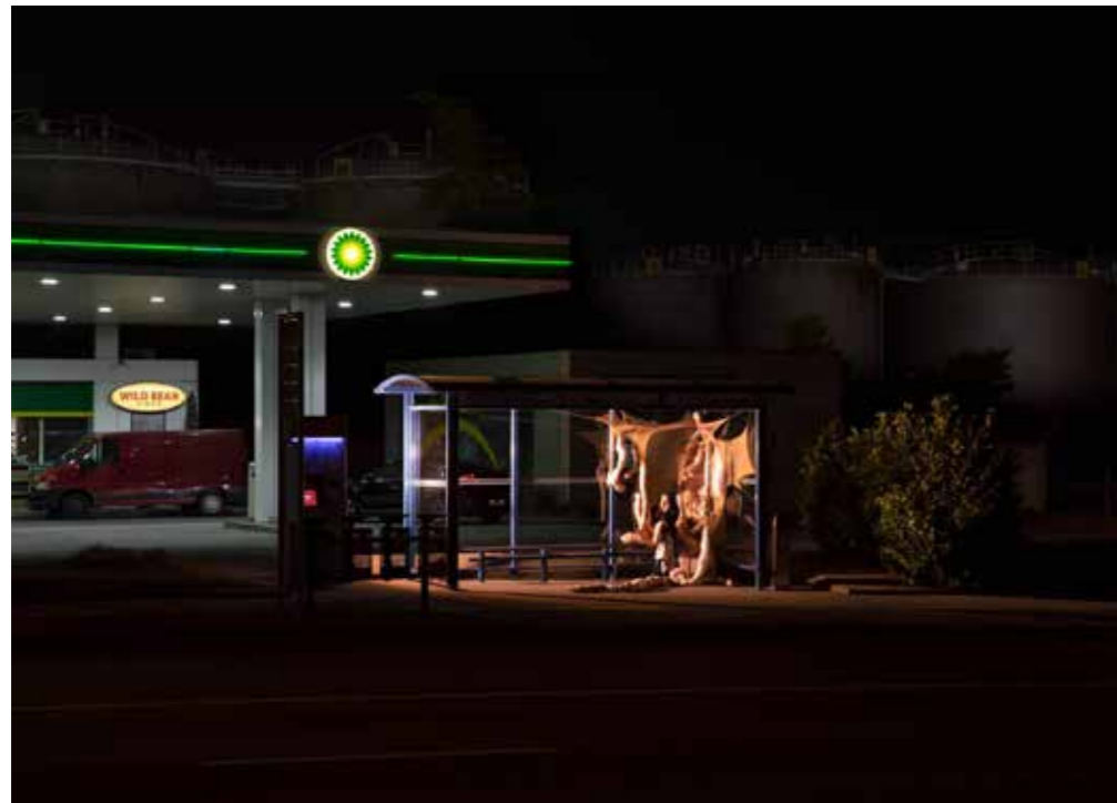
FIGURA 10 Des Corps dans la Nuit , 2022. Líderes de Workshop: Paule Perron, Julien Lafontaine; estudiantes HEAD — Genève. FIGURE 10 Des Corps dans la Nuit , 2022. Workshop leaders: Paule Perron, Julien Lafontaine; students HEAD — Genève.