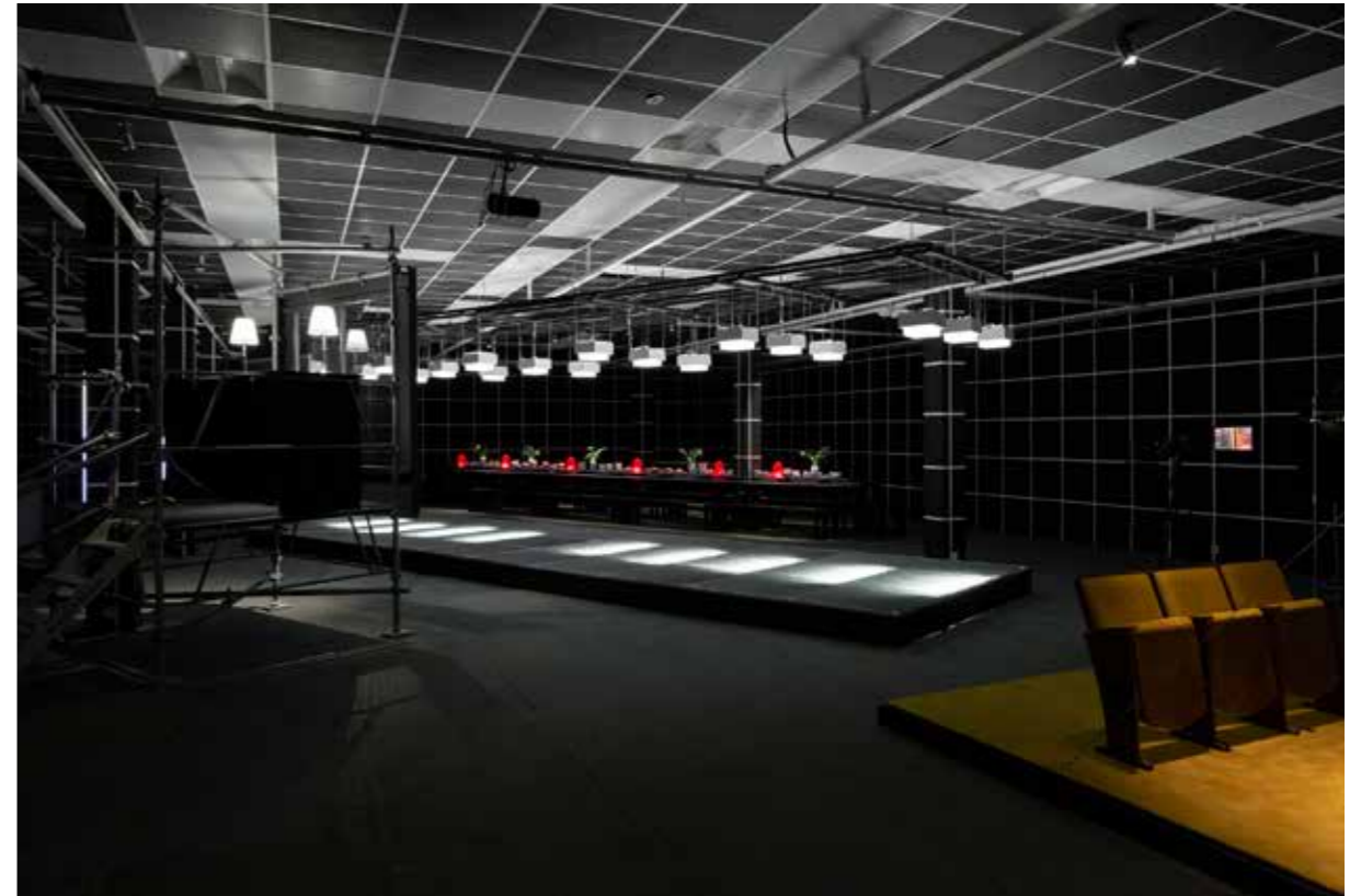
FIGURA 2 Scènes de Nuit . Exposición nocturna en F'ar Lausanne, 2019. Curadores: Javier F. Contreras, Youri Kravtchenko; Asistente: Manon Portera; Escenografía: estudiantes HEAD — Genève.

However, a comprehensive nocturnal epistemology of architecture remains unwritten, especially for the epochs and historical periods preceding the diffusion of industrial technologies and in non-Western geographical areas. Recognizing this gap, the Department of Interior Architecture at HEAD — Geneva initiated an ambitious research project in 2019 that aims to challenge the conceptualization of architectural design by focusing on the nocturnal understanding of the built