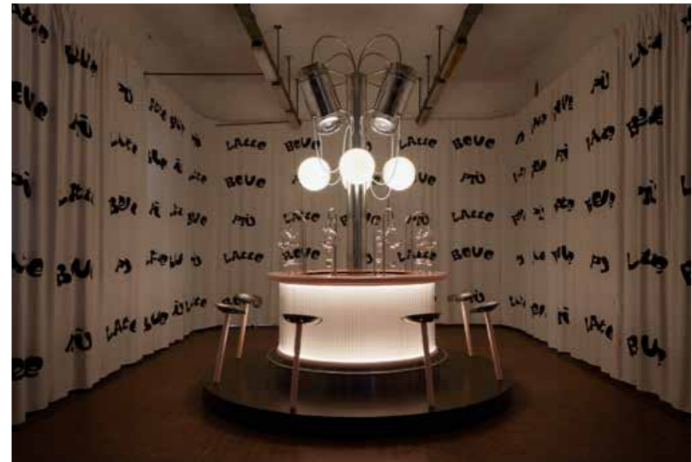
FIGURAS 4-5 Milk Bar. Semana del Diseño de Milán, 2021. Líderes de proyecto: India Mahdavi, Youri Kravtchenko; Escenografía: Lolita Gomez, Blanca Algarra, estudiantes HEAD - Genève.

FIGURES 4-5 Milk Bar. Milan Design Week, 2021. Project leaders: India Mahdavi, Youri Kravtchenko; Scenography: Lolita Gomez, Blanca Algarra, students HEAD - Genève.