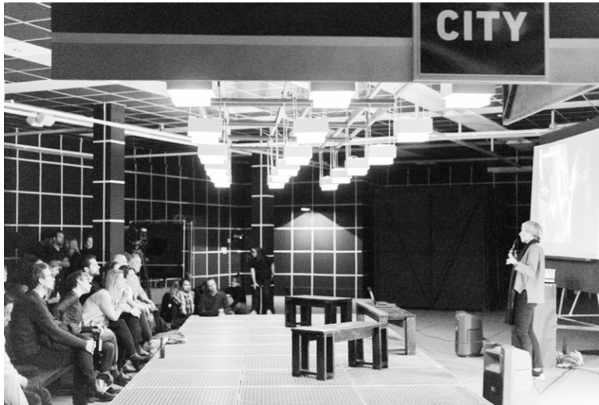
FIGURA 3 Scènes de Nuit . Exposición nocturna en F'ar Lausanne, 2019. Curadores: Javier F. Contreras, Youri Kravtchenko; Asistente: Manon Portera; Escenografía: estudiantes HEAD — Genève.

FIGURE 3 Scènes de Nuit . Nocturnal Exhibition at F'ar Lausanne, 2019. Curators: Javier F. Contreras, Youri Kravtchenko; Assistant: Manon Portera; Scenography: students HEAD — Genève. © Lea Kloos