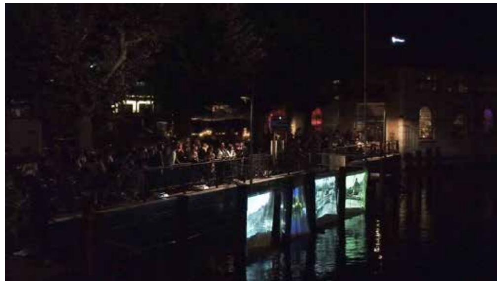
FIGURA 11 After Sunset, Before Sunrise , 2021. Líderes de Workshop: Manon Portera, et al.; estudiantes HEAD — Genève. FIGURE 11 After Sunset, Before Sunrise , 2021. Workshop leaders: Manon Portera, et al.; students HEAD — Genève. © HEAD — Genève.

impacto que han tenido el entretenimiento y el uso recreativo de edificios y espacios urbanos, describiendo también las características de la arquitectura nocturna posmoderna y contemporánea. Este grupo de textos también analiza los entrelazamientos entre el espacio, la tecnología y los medios de comunicación desde un punto de vista nocturno.