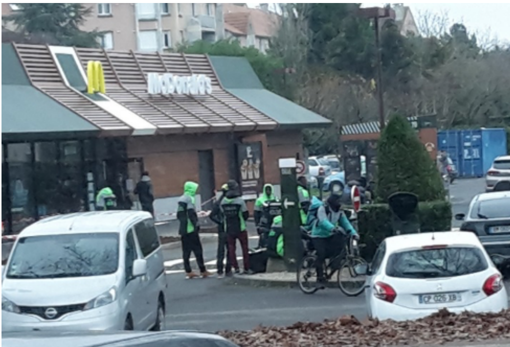
Photographie 2. Les coursiers attendent ensemble devant un restaurant

Mehdi, 21 ans, licence 2 de biologie, Deliveroo, ~ 15h/sem. Entretien réalisé à Poitiers, le 17/05/2019