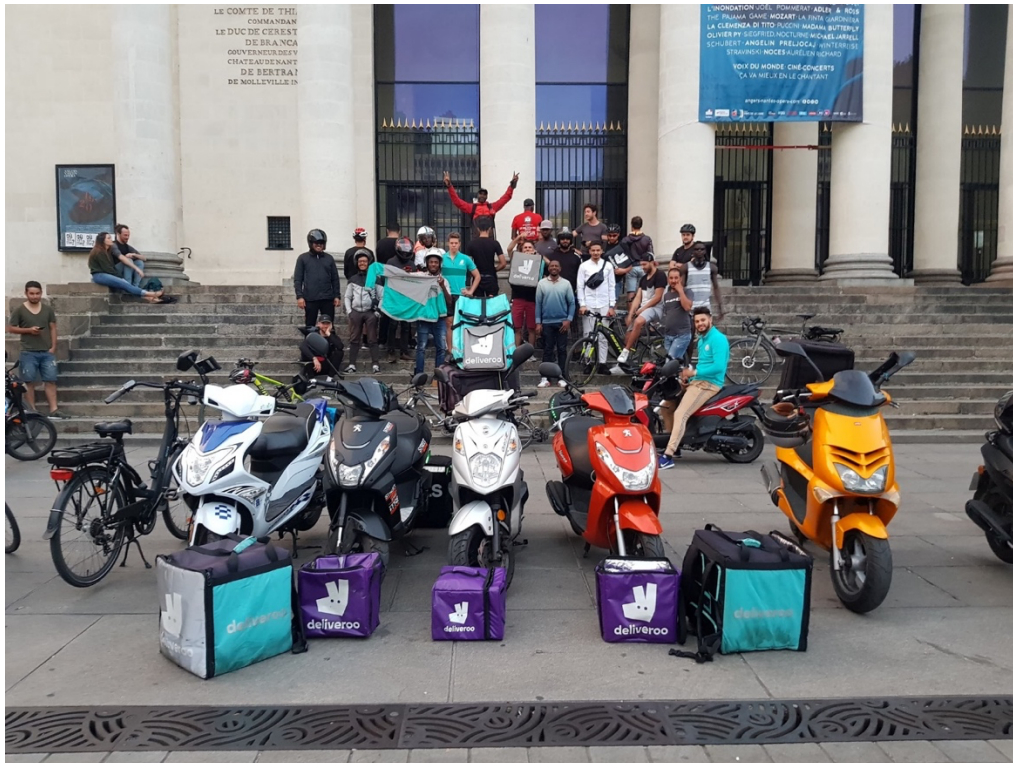
Photographie 6. Mobilisation de coursiers nantais en août 2019