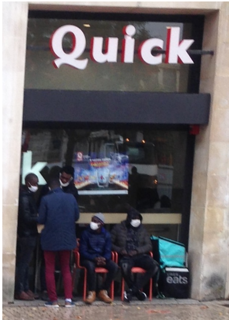
Photographie 5. Des coursiers postés devant le restaurant Quick Poitiers. 02 novembre 2020 Un jour pluvieux, les coursiers attendent les commandes et se sont abrités contre la devanture du restaurant et installés sur des chaises inutilisées par les clients.

La société Uber Eats a organisé en mars 2019 une consultation auprès de ses livreurs 18 qui intègre les critiques de riverains, commerçants, restaurateurs ou municipalités et cherche à intervenir pour réguler leur présence ostensible. C'est ce qu'explique une des cadres de l'entreprise, stigmatisant les comportements d'incivilité de certains :