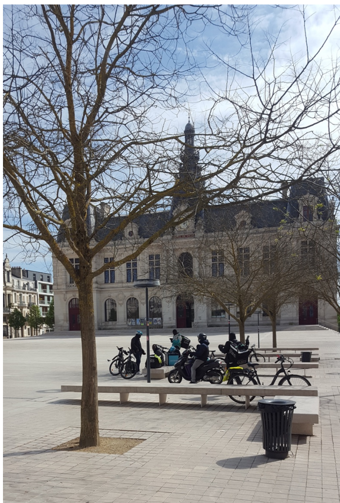
Photographie 9. Des coursiers attendent leur commande pendant le confinement

Crédit : Hélène Stevens, Poitiers, le 8 avril 2020 à 12h08, pendant le confinement