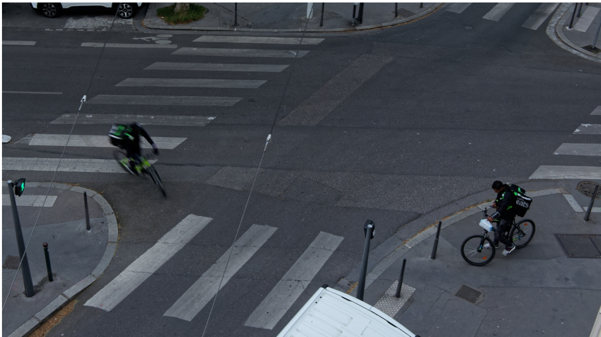
Photographie 3. La course en actes (1). Foncer ou chercher son itinéraire

Entretien réalisé à Poitiers, le 13/02/2019