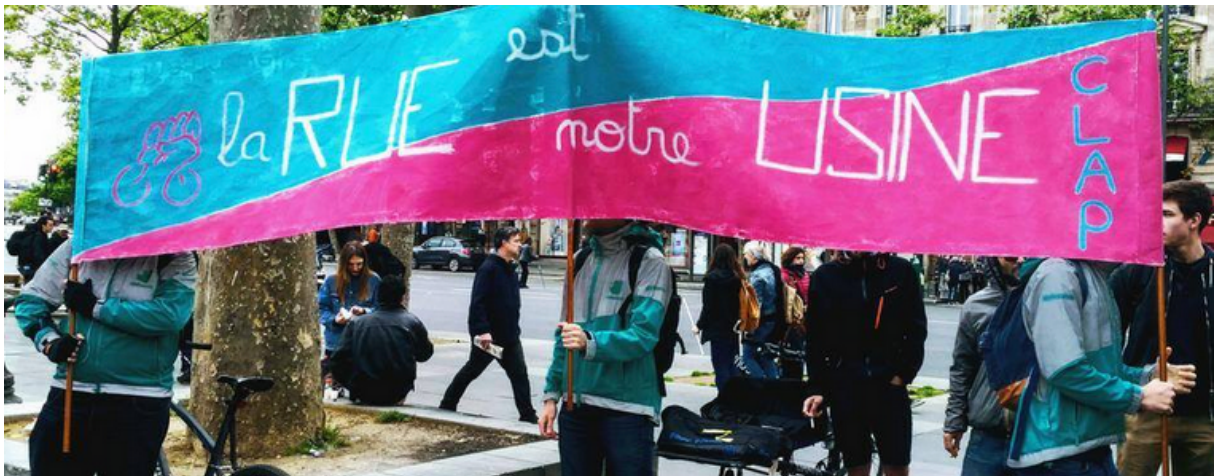
Photographie 1. « La rue est notre usine ». Manifestation des coursiers parisiens Source. Page Facebook du CLAP, Collectif des Livreurs Autonomes de Paris, Paris, mai 2017

« La rue est [leur] usine » comme l'affirme à juste titre le slogan de livreurs mobilisés pour défendre leurs droits et revendiquer de meilleures conditions de travail et de rémunération (photo 1).