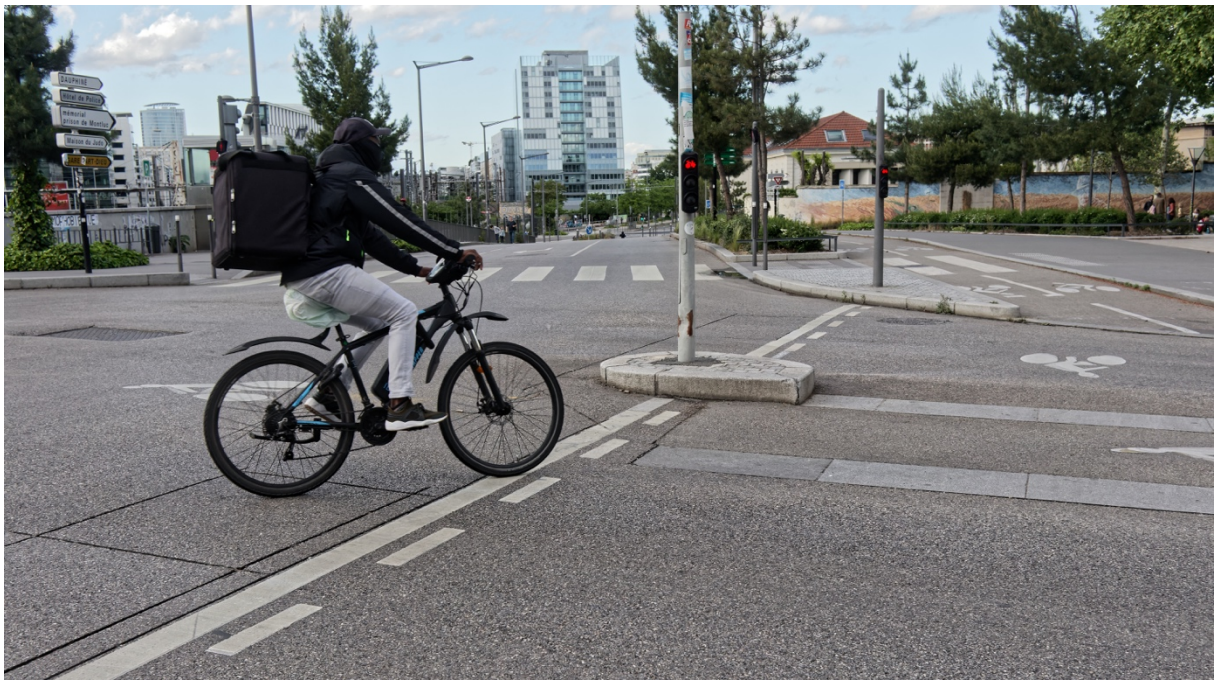
Photographie 4. La course en actes (2). Foncer et prendre des risques

Hugo, 24 ans, études de développeur informatique, Deliveroo, ~ 35h/sem. Entretien réalisé à Bordeaux, le 20/02/2019