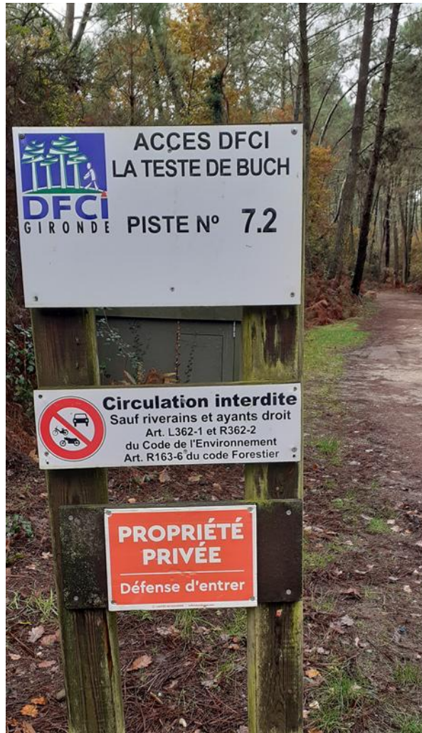
Figure 5 : Panneau d'entrée d'un chemin DFCI en Forêt usagère.

Dans la partie domaniale du massif forestier, la forêt ne présente pas les mêmes aménités et aménagements que la forêt usagère. Du côté de l'étang de Cazaux, les quelques cabanes de résiniers conservées par l'ONF, comme à Curepipe, ont été rénovées en espace d'accueil pour les touristes. Des stations d'informations pédagogiques sont disposées et renseignent les promeneurs sur l'exploitation passée de la gemme. Du côté de l'océan, les pins ne sont pas tous plantés en rangs, leur exploitation n'est pas aussi intensive que sur le plateau landais. Leur rôle premier est de fixer la dune contre l'érosion, même si les expériences menées par l'ONF n'ont pas toujours eu les effets escomptés. Dans le but de limiter la dispersion des touristes accusés de provoquer des incendies, l'ONF a décidé de fermer l'accès à la forêt domaniale (Figure 6), ce qui suscite de fortes critiques de la part des habitants.