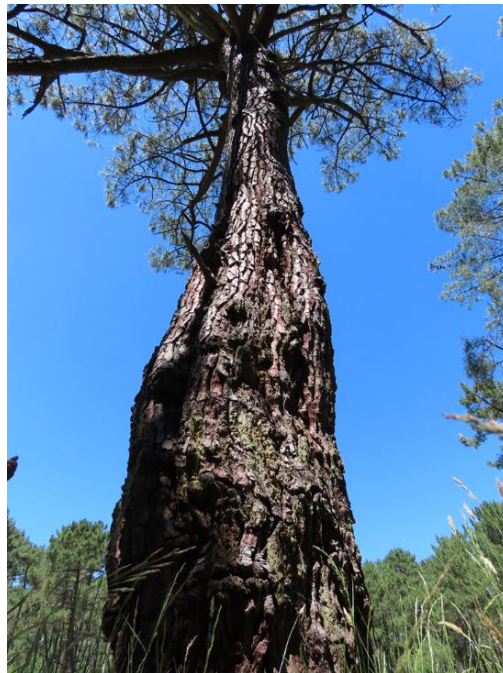
Figure 4 : pin bouteille de la Forêt usagère.

On peut penser aussi que le gemmage a permis le maintien des droits locaux de la forêt usagère. Les propriétaires n'ont pas la jouissance de l'arbre mais ils perçoivent les revenus de la résine de l'arbre. La récolte de la résine, transformée ensuite en térébenthine, a ainsi été une activité rentable jusque dans les années 1970. La concurrence défavorable avec les pays du Sud a entraîné l'effondrement progressif des métiers de la résine largement occupés après-guerre par des immigrés espagnols et portugais. Les chemins de la Forêt usagère étaient alors plus dégagés qu'aujourd'hui. De cette époque de gemmage intensif, la forêt conserve des pins bouteilles (Figure 4) dont la forme arrondie fut causée par une exploitation excessive de leur résine. Depuis les années 1980, le paysage se referme, les broussailles envahissent les versants des dunes et à présent on observe une progression du chêne liège des bas vers les hauts des dunes. Depuis que la rente de la résine a disparu, certains propriétaires cherchent à imposer leurs droits de propriété sur les arbres (qu'ils n'ont jamais eus), tandis que d'autres militent pour un retour de l'activité de gemmage qui pourrait s'insérer dans une logique de circuit-court, certifiée et publicisée.