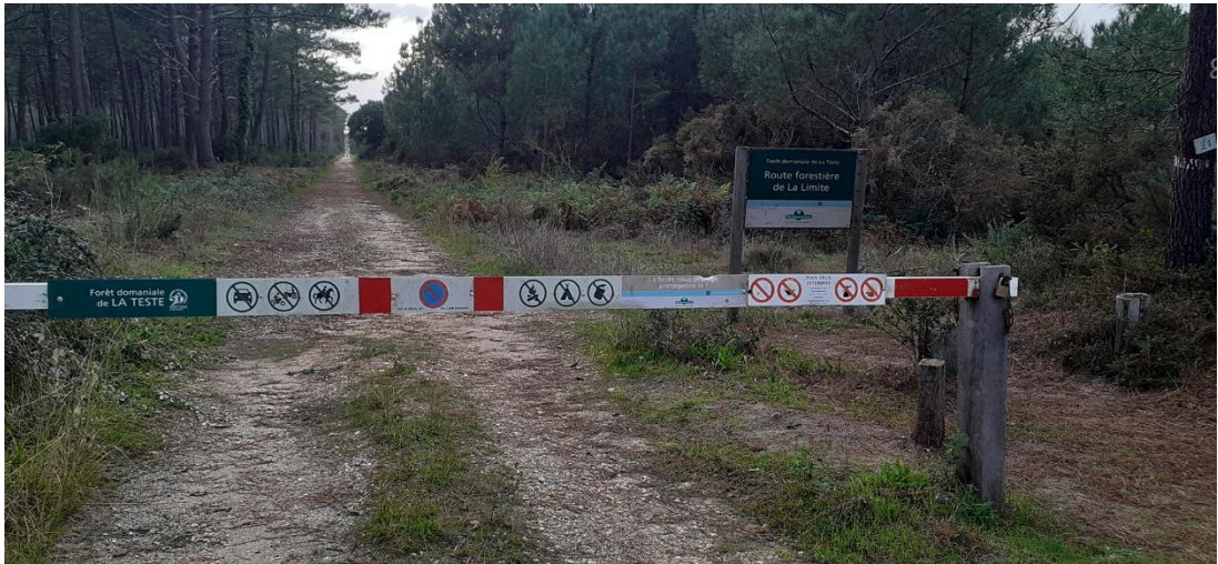
Figure 6 : barrière à cadenas à l'entrée de la forêt domaniale de La Teste de Buch.

L'objectif est de concentrer le flux touristique sur la dune du Pyla. Un agent de l'ONF justifie cette politique d'enclosures : « « La forêt publique n'existe pas, c'est un abus de langage. Il n'y a que des forêts privées, et notre rôle à l'ONF c'est d'en être les gardiens » (entretien du 27/09/2021).