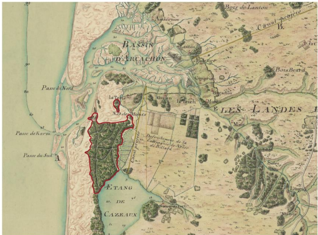
Figure 3 : Nouvelle carte de la Guienne avec les canaux de navigation projetés, par Clavaux, 1774 (Source : BNF). En rouge, le périmètre approximatif de la forêt usagère.

ancienne », à distinguer de la forêt moderne de l'Etat sur la partie littorale. En effet, la forêt domaniale est plus récente. Son peuplement s'inscrit dans les grandes campagnes de boisement du XIXème siècle. Il s'agit de semis et de plantations réalisés par l'ingénieur Brémontier 4 lors des travaux de fixation des dunes.