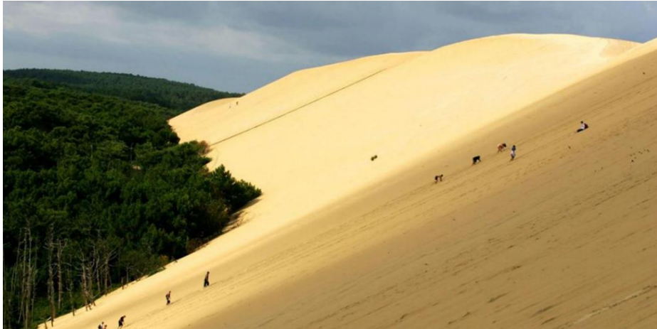
Figure 1 : La forêt usagère de La Teste de Buch au pied de la grande dune du Pyla.