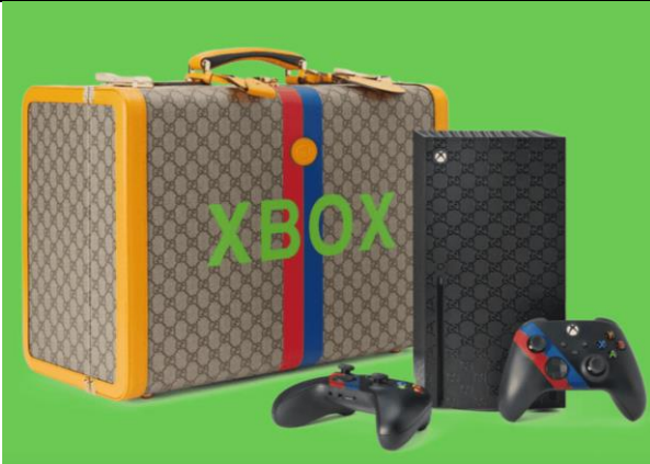
Gucci - Xbox (2021)