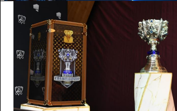
Louis Vuitton – League of Legends (2019)