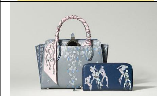
Bulgari – Jojo's Bizarre Adventure (2017)