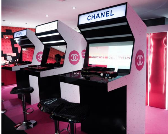
Channel - Borne d'arcade (2018)