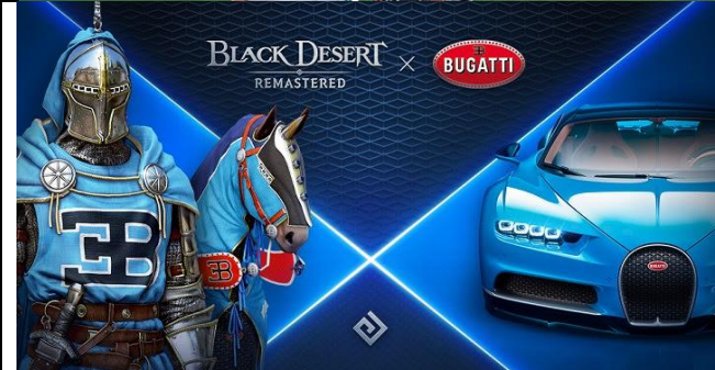
Bugatti – Black Desert Remastered (2021)