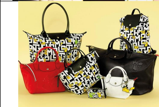
Longchamps et Pikachu (2020)