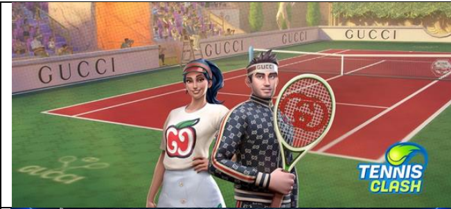
Gucci – Tennis Clash (2020)