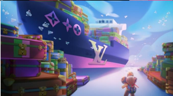
Louis Vuitton (2021)