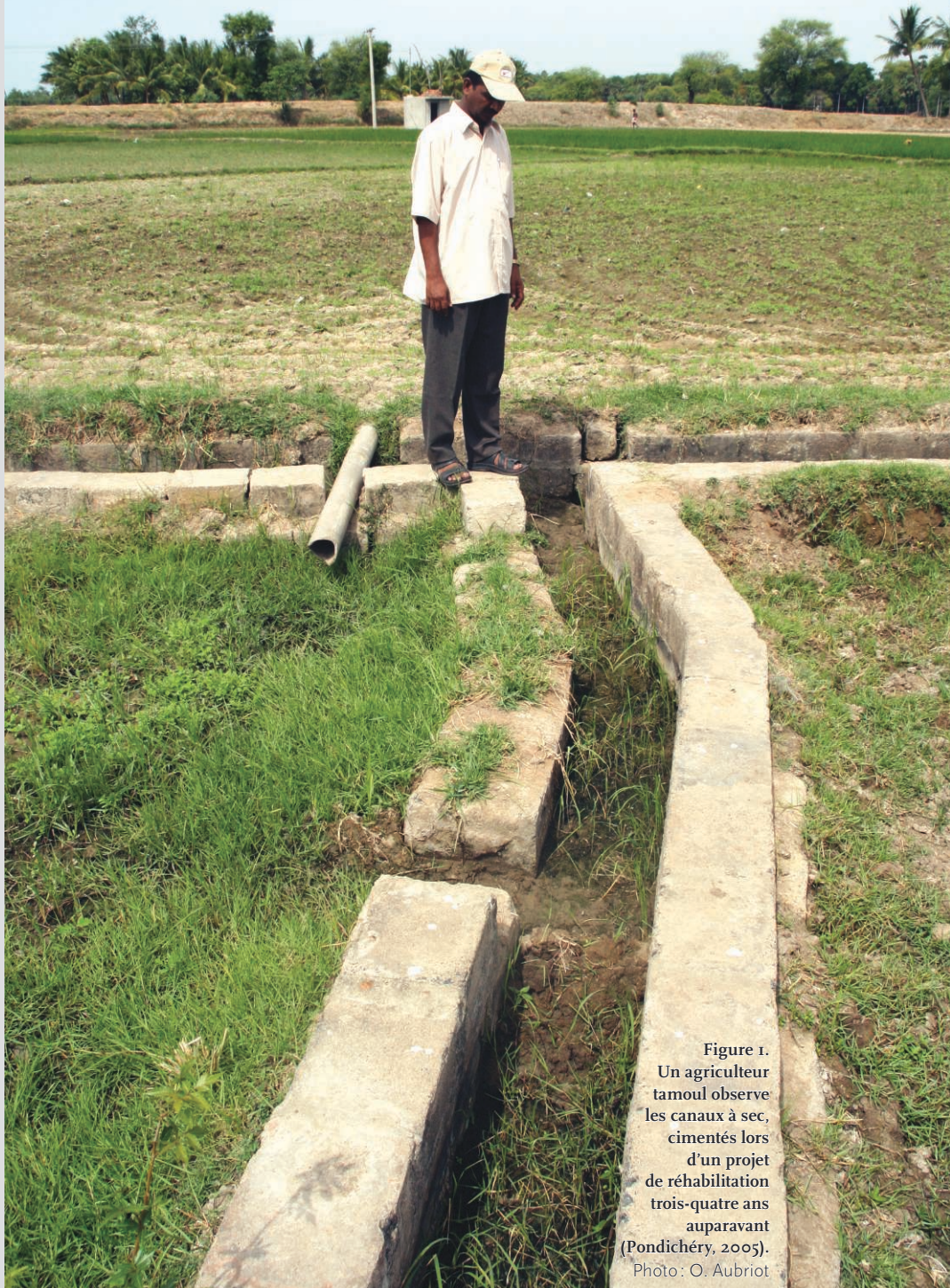
Figure 1. Un agriculteur tamoul observe les canaux à sec, cimentés lors d'un projet de réhabilitation trois-quatre ans auparavant (Pondichéry, 2005).