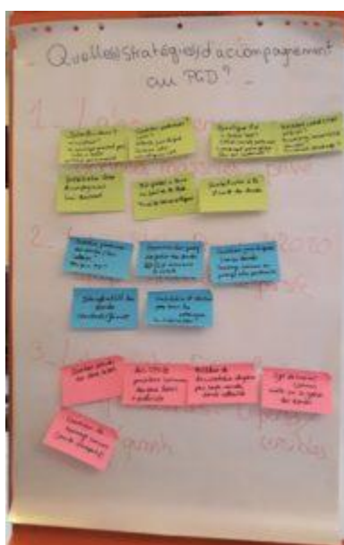
Quelques pistes pour monter des stratégies d'accompagnement personnalisées.

Ces moments de réflexion ont ainsi été l'occasion de solliciter l'ensemble des notions abordées au cours du stage.