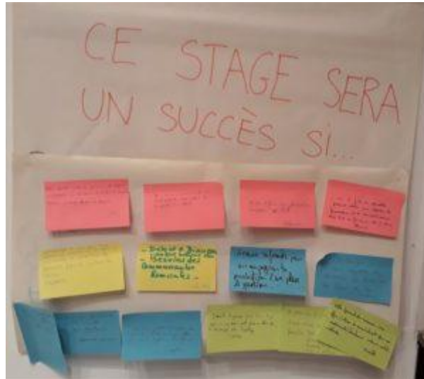
Recueil des attentes des stagiaires

La première demi-journée a été consacrée à une remobilisation de connaissances sur ce qu'est un PGD, et les notions qu'il peut aborder. Ce rappel a consisté en un balayage du déroulé du stage sur les plans de gestions proposé au catalogue de l'URFIST de Paris, lui-même fortement inspiré de la formation proposée par l'ex-INRA sur ce même format d'une journée. Il a été l'occasion d'une réflexion commune sur certaines thématiques parfois difficiles à exposer de manière claire, comme la notion de « produits de la recherche » utilisée par la plateforme DMP-OPIDoR, ou sur lesquelles on manque encore d'informations, comme l'estimation des coûts liés à la gestion des données.