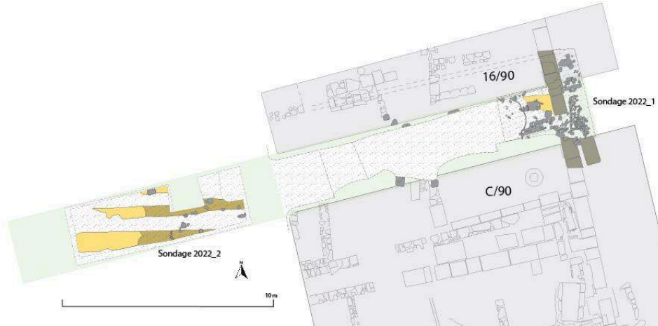
Fig. 3. Plan des sondages 2022_1 et 2022_2 en fin de fouille.