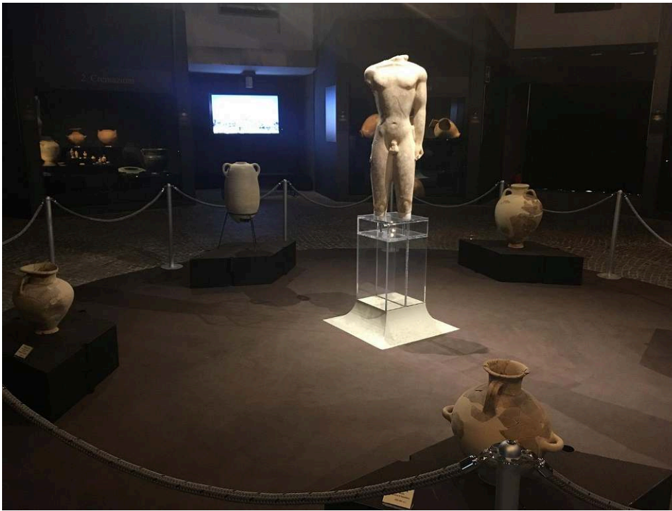
Fig. 9. Exposition sur la nécropole Sud de Mégara Hyblaea au Musée de Syracuse.