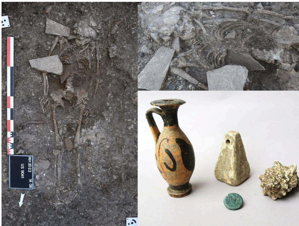
Fig. 7. La SP 9009 en cours de fouille, vue générale et de détail.