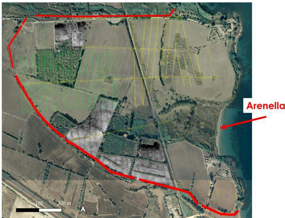
Fig. 1. Vue d'ensemble du site de Mégara Hyblaea avec mis en évidence le tracé des remparts archaïques, les principaux réseaux de rues et la zone de l'Arenella.

© fond : Google Map ; élaboration : Fr. Mège Ecco Fatto Arceo.