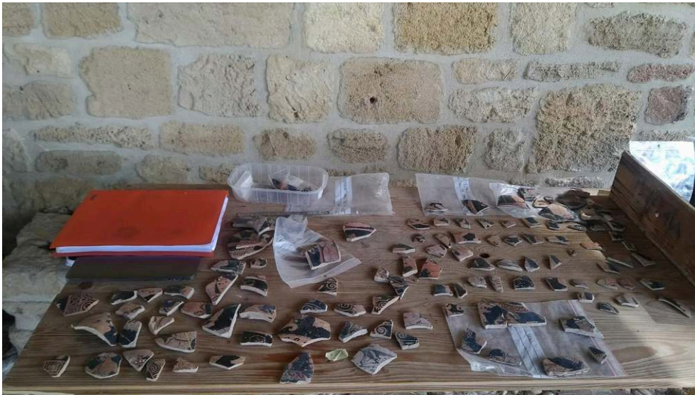
Fig. 8. Étude en cours de la céramique hellénistique.