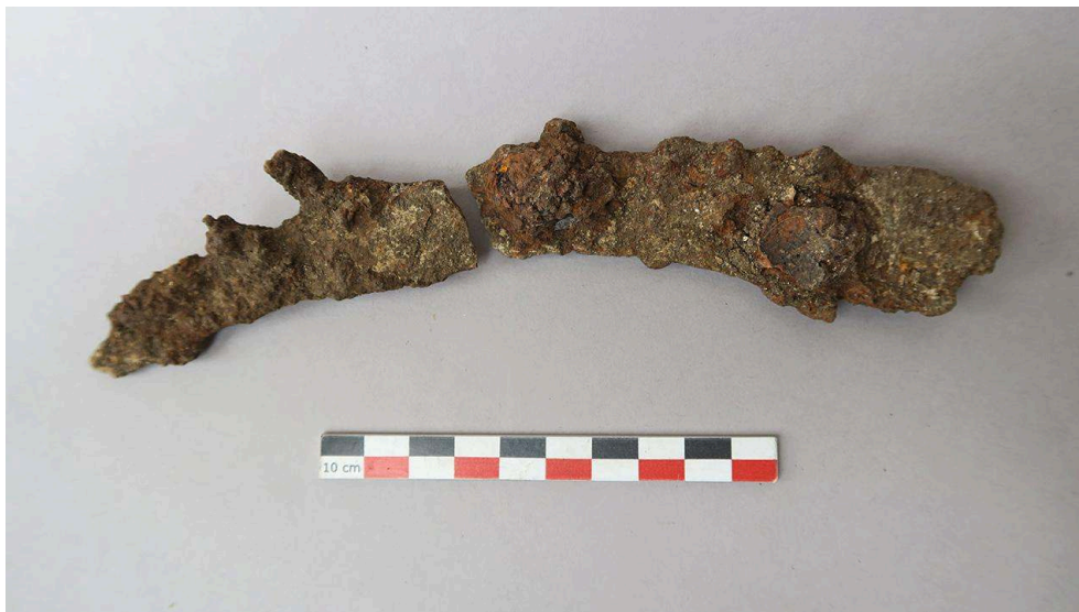
Fig. 6. La lame de fer découverte près de la tête de l'individu de la SP 9043.