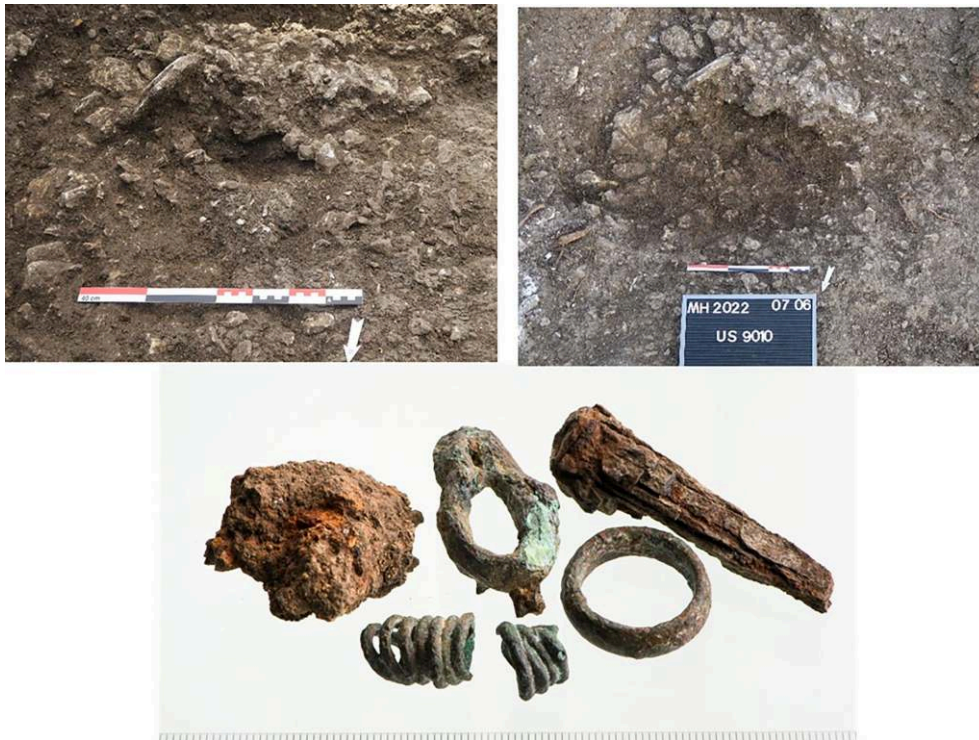
Fig. 5. Le dépôt secondaire à crémation SP 9001 fouillé par moitié, en cours de fouille et après enlèvement des os brûlés.

© R.-M. Bérard, CNRS, CCJ ; les objets métalliques brûlés avec le défunt © L. Damelet, AMU, CCJ.