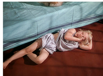
[Séq. Mort de Bogey à 01 : 14 : 48]