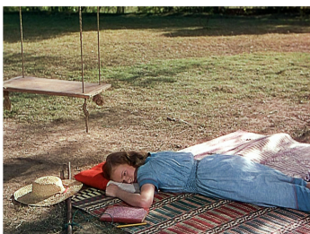
[Séq. Mort de Bogey à 01 : 14 : 51]