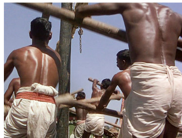
[Séq. Les rameurs à 00 : 03 : 05]