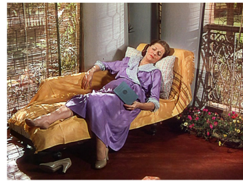
[Séq. Mort de Bogey à 01 : 14 : 05]