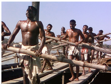
[Séq. Les rameurs à 00 : 02 : 59]

Le cortège des fictions cinématographiques occidentales où sont susceptibles d'apparaître des topoi de l'Orient est tel qu'il serait presque impossible de démêler l'écheveau des motifs qui circulent d'un film à l'autre 2 . Qu'il le sache ou non, tout spectateur est redevable à de telles représentations d'avoir construit son propre regard sur le lointain et l'Autre, et ce d'autant plus que le cinéma n'a cessé de populariser de tels poncifs pour ses propres besoins, en particulier économiques. La fabrique occidentale des films sur l'Inde britannique 3 , qu'il s'agisse du cinéma véritablement anglais ou du genre « cinéma colonial anglais » qui sortait majoritairement, en fait, des studios hollywoodiens, n'échappe pas à la règle. En multipliant les connivences avec ses publics, l'industrie cinématographique cherche surtout à s'inscrire dans une cinéphilie du grand spectacle dans laquelle la position victorieuse et dominante de ses divers héros occidentaux s'éprouve et se vérifie justement au contact avec cet Autre. Dans un contexte actuel d'hégémonie des productions hollywoodiennes, en termes d'écrans et de marché, et ceci malgré la vivacité du cinéma indien, le cinéma à l'ère postcoloniale est loin d'en avoir fini avec la question d'une posture dominante qui s'exerce toujours dans le même sens.