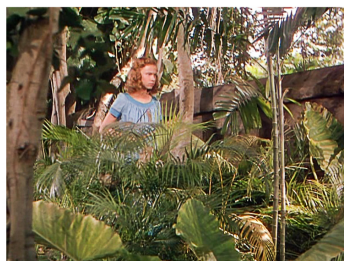
[Séq. Mort de Bogey à 01 : 16 : 00]