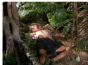
[Séq. Mort de Bogey à 01 : 16 : 20]