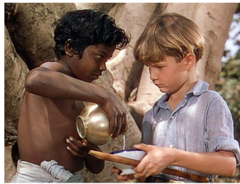
[Séq. Mort de Bogey à 01 : 13 : 55]