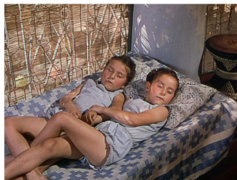
[Séq. Mort de Bogey à 01 : 14 : 37]