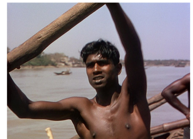
[Séq. Les rameurs à 00 : 03 : 13]