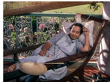
[Séq. Mort de Bogey à 01 : 14 : 22]