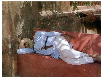
[Séq. Mort de Bogey à 01 : 14 : 19]