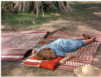
[Séq. Mort de Bogey à 01 : 13 : 39]

The River , c'est son titre original lors de sa sortie aux États-Unis en 1951, est le premier film couleur de Jean Renoir et il constitue une charnière entre sa période américaine entamée en 1941 et son retour en Europe en 1952. À la fois premier exemple de fiction occidentale exclusivement tournée en Inde et premier usage de la couleur dans la représentation filmique de ce pays, il fait figure de précédent, par exemple pour Roberto