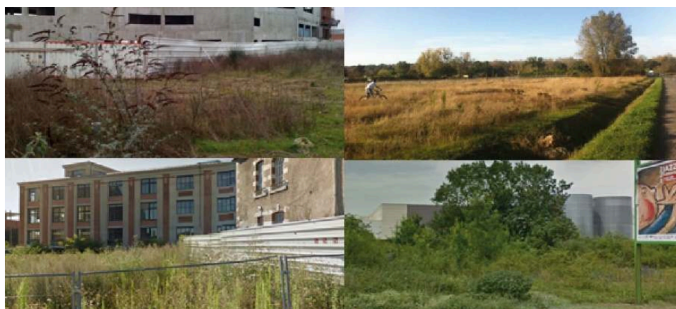
Figure 1 - exemples des diverses formes de friches urbaines (photographies prises à Tours et Blois en 2015 ; crédits photos : M. Brun).

non gérés, sont en effet colonisés par une flore spontanée (Bonthoux et al. , 2014 ; McKinney, 2021 ; Muratet et al. , 2007). Intégrer les friches urbaines aux politiques environnementales favoriserait la biodiversité végétale spontanée en ville. La valeur des friches urbaines pour la biodiversité est reconnue par les sciences environnementales, bien que les études sur cette question traitent principalement de grandes aires urbaines (Bonthoux et al. , 2014). En Europe par exemple, des études ont été réalisées à Paris (Muratet et al. , 2007), Bruxelles (Godefroid et al. , 2007) ou encore Berlin (Meffert et al. , 2012 ; Kowarik, 2013). Mais les zones urbaines de taille plus restreinte, qui sont pourtant souvent caractérisées par une urbanisation extensive, propices à l'apparition de friches urbaines dans des espaces en déprise (Santamaria, 2000 ; Dumont, 2005), sont rarement étudiées. Bien que certains travaux aient exploré la dimension foncière et stratégique des friches, principalement en urbanisme (Ambrosino et Andrès, 2008 ; Andrès, 2011 ; Serre, 2017), la question de la prise en compte de l'intérêt des friches urbaines pour la biodiversité dans les politiques publiques reste peu connue.