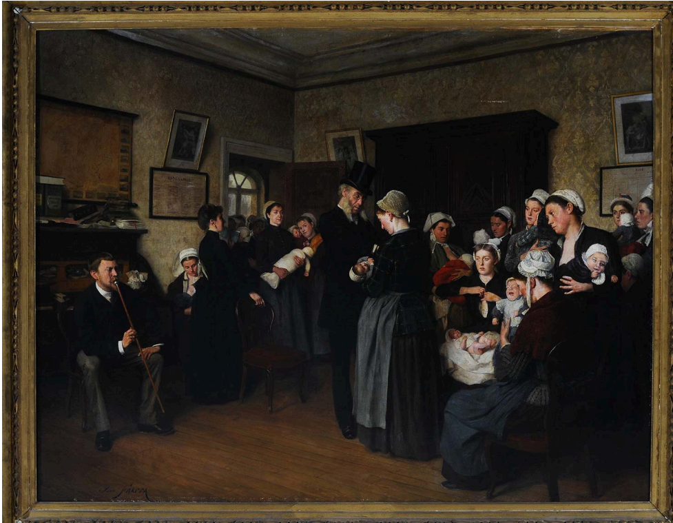
Figure 7 : José Frappa, Un bureau de nourrices

Huile sur toile, 158 x 129 cm, musée de l'Assistance publique – Hôpitaux de Paris, inv. AP 210, © AP-HP/musée – F. Marin