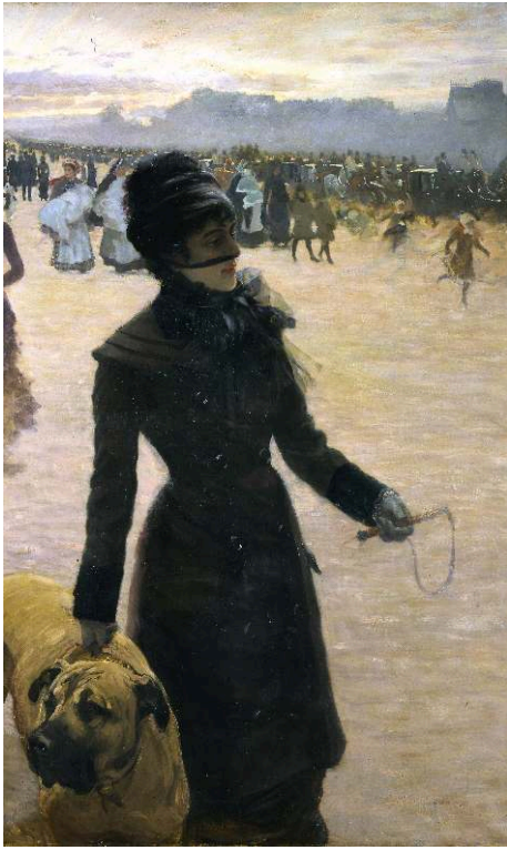
1878, huile sur toile, 156 x 99 cm, Trieste, Civico Museo Revoltella Galleria d'Arte Moderna, inv. n°375