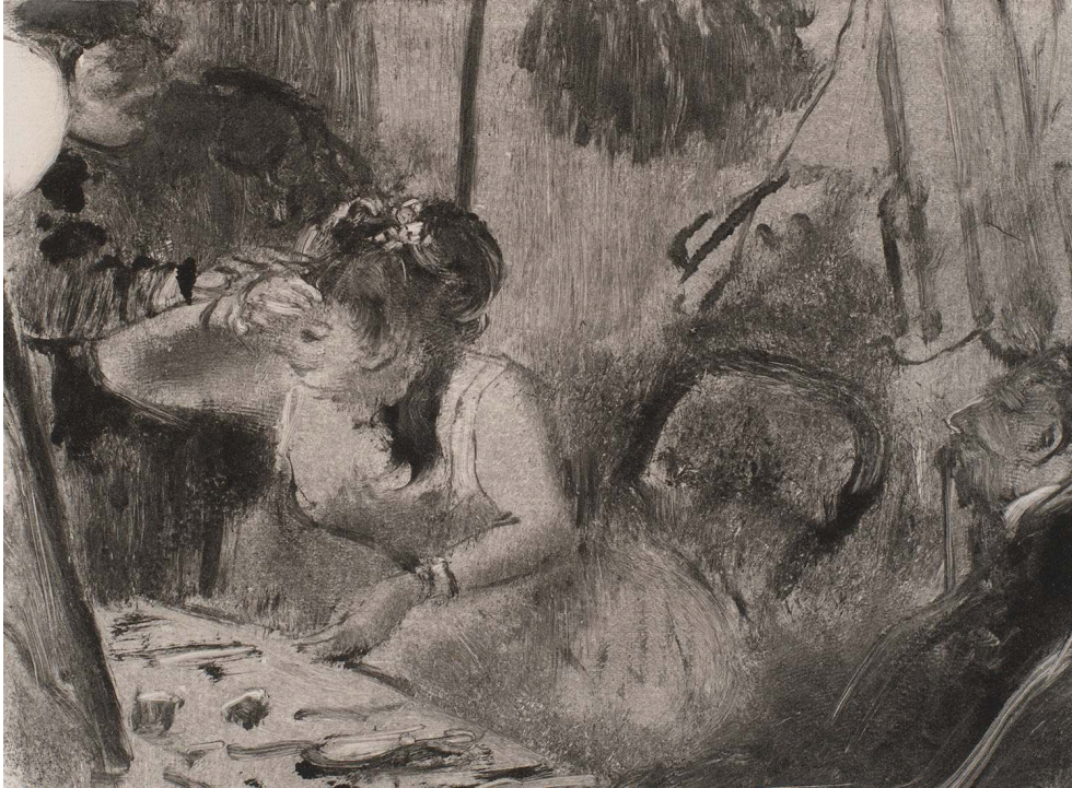
Figure 8 : Edgar Degas, L'intime

Vers 1877, monotype, 11,8 x 16,1 cm, inv. KKS9159, Copenhague, Statens Museum for Kunst, domaine public/CC0