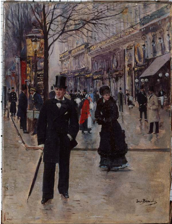
1885, huile sur toile, 33 x 25 cm, Paris, musée Carnavalet, CC0 Paris Musées / Musée Carnavalet - Histoire de Paris