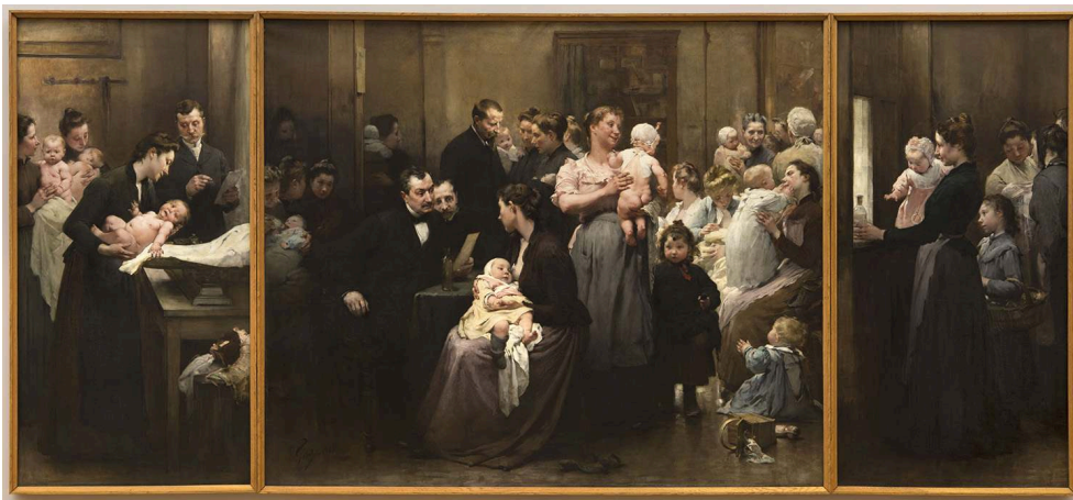
Figure 3 : Jean Geoffroy dit Géo, La Goutte de lait de Belleville

Triptyque : la pesée, la consultation, la distribution du lait , 1903, peinture à l'huile, 254 x 548 cm, Petit-Palais, musée des Beaux-Arts de la Ville de Paris, CC0 Paris Musées / Petit Palais, musée des Beaux-Arts de la Ville de Paris