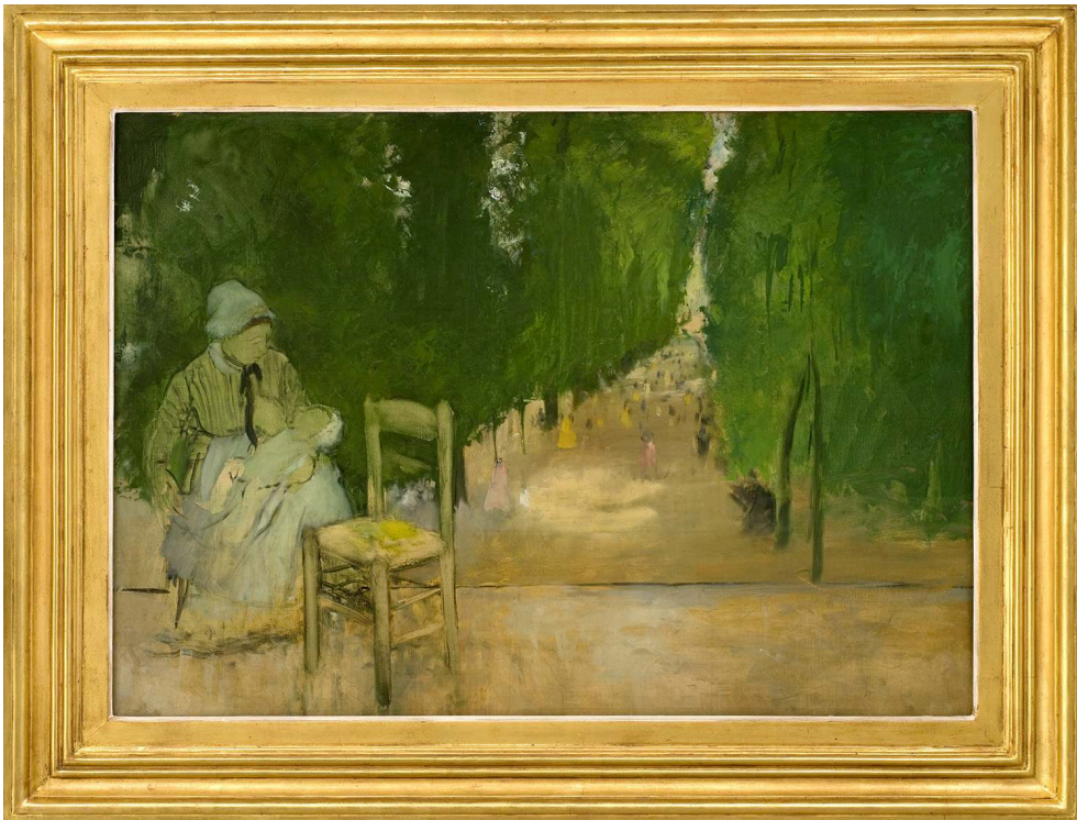
Figure 9 : Edgar Degas, Une nourrice au jardin du Luxembourg

Vers 1872, huile sur toile, 65 x 92 cm, Montpellier, musée Fabre, inv. 58.3.1, © Musée Fabre de Montpellier Méditerranée Métropole / photographie Frédéric Jaulmes - Reproduction interdite sans autorisation.