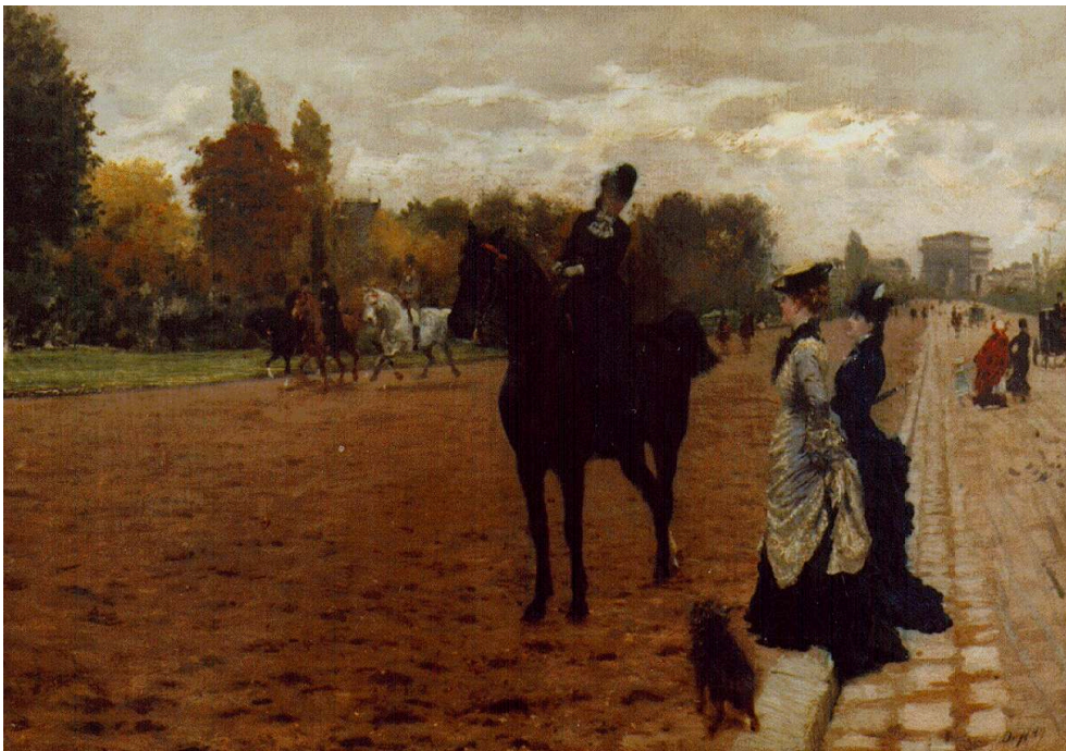
1874, huile sur toile, 30 x 42 cm, Gênes, Civiche Raccolte Frugone, © Museo delle Raccolte Frugone - Genova.