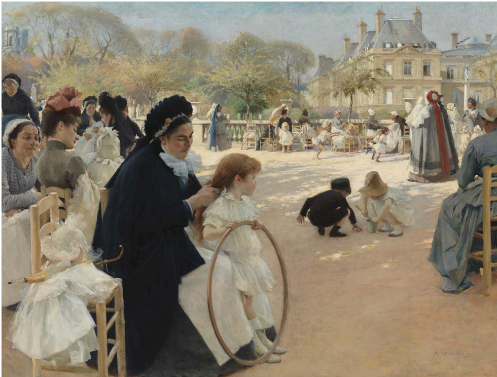
1887, huile sur toile, 141 x 186 cm, Helsinki, Ateneum Art Museum