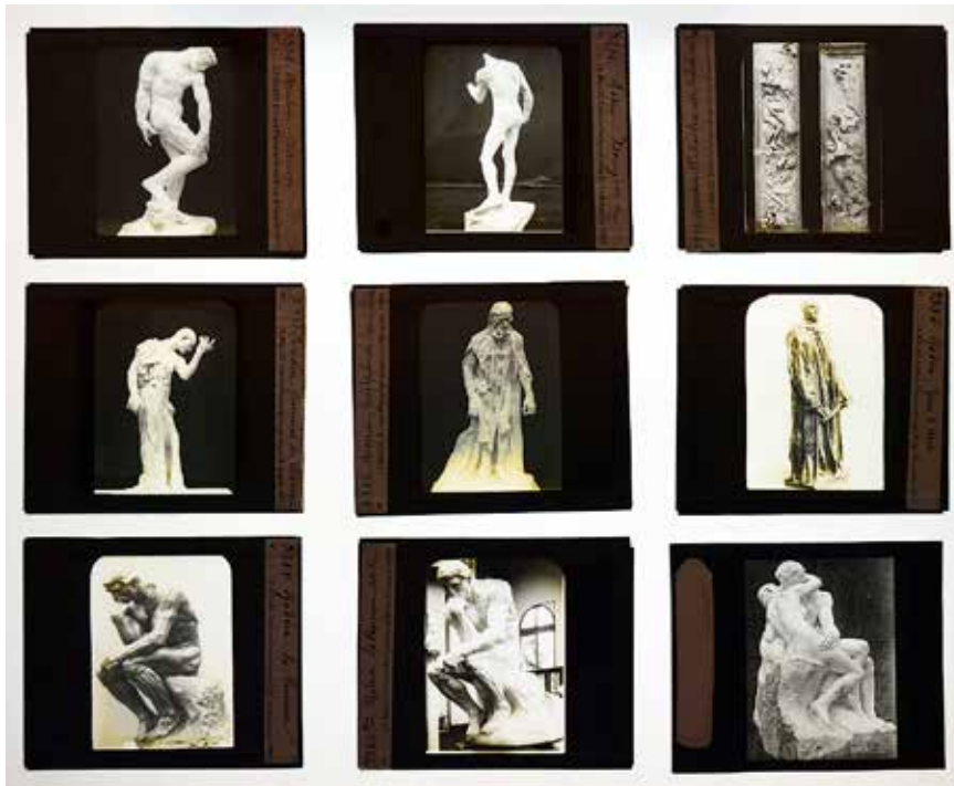
3. Ensemble de plaques photographiques de projection, début du XX e siècle, Brive-la-Gaillarde, musée Labenche d'art et d'histoire (DOC.2021.LOT13).