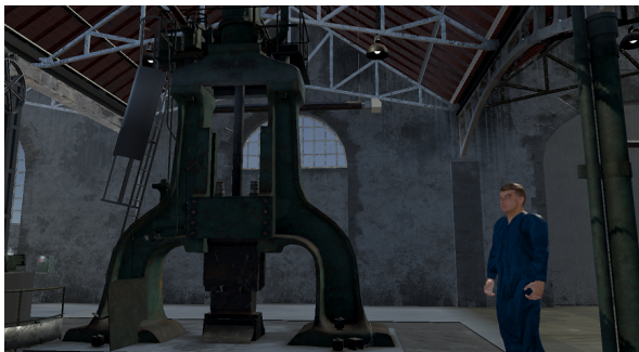
FIGURE 1 – L’environnement virtuel basé sur les forges de Pontaniou