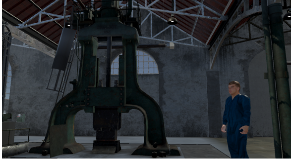
FIGURE 1 – L’environnement virtuel basé sur les forges de Pontaniou