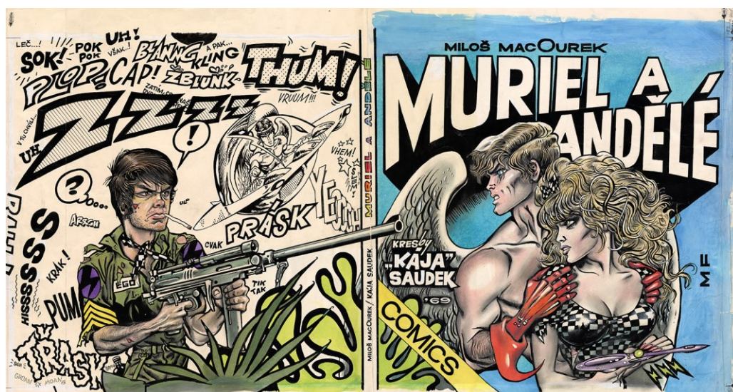
Figure 8. Couverture originale dessinée pour Muriel a andělé . Reproduction avec l'aimable autorisation de Berenika Saudková.

Muriel a andělé a été publié pour la première fois en 1991 après la chute du régime communiste en Tchécoslovaquie, dans une version, semble-t-il, assez proche du projet d'édition initial. On peut y lire les dialogues qu'entretient la bande dessinée avec Kdo chce zabit Jessii? . Saudek y reprend l'idée d'un générique dessiné, où il se crédite en tant que režisér (réalisateur).