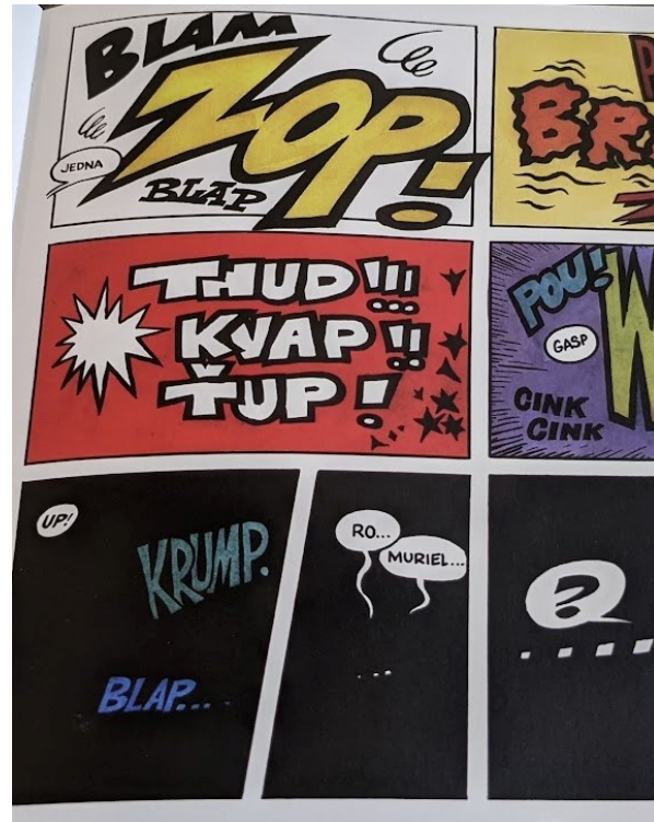
Figures 9 et 10. Miloš Macourek et Kája Saudek, Muriel a anděl , Prague, Comet, 1991, p. 15 et p. 87.

Il reprend les traits caractéristiques développés dans les années 1960, avec le jeu sur la structure des cases en parallélogramme qui provoque des effets d'irrégularité et de déséquilibre permanents. Les onomatopées y sont