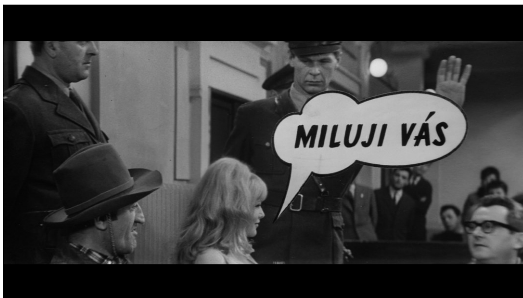
Figure 4. Jessie s'exprimant par une bulle. Václav Vorlíček, Kdo chce zabít Jessii? , 1966.

des actions, en vue de l'établissement de l'action principale, sont susceptibles d'opérer, comme au cinéma, en alternance ou parallèlement 25 ». Plus tard, lorsque l'univers de la bande dessinée se déverse dans le réel, un transfert des images fixes aux images animées s'effectue. Les personnages se transforment en acteurs, tout en conservant leurs caractéristiques : ils sont muets et ne s'expriment qu'à travers des bulles qui se matérialisent et sont lues par les personnes réelles, ils ne sont pas limités par les contraintes corporelles et ils possèdent des capacités surhumaines, leur permettant par exemple de voler.