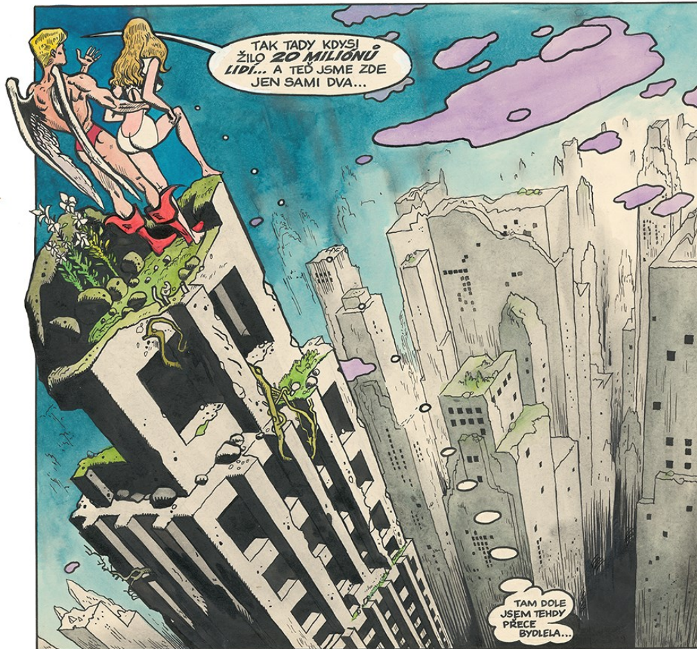
Figure 13. Affiche élaborée pour l'exposition Kája Saudek: the King of Czech Comics , Dancing House Gallery à Prague, 2019.

En 2006, un accident le plonge dans un coma dont il ne s'est jamais réveillé. Fascinante et protéiforme, l'œuvre de Kája Saudek est au carrefour de diverses influences, souvent inattendues pour un auteur qui a écrit la majorité de son œuvre dans un pays socialiste d'Europe centrale, traversé à plusieurs reprises par des moments de reprise en main idéologique assez brutaux. Jessie et Muriel incarnent à leur manière cette révolution sociale qui est à l'œuvre en Tchécoslovaquie dans les années 1960, régulièrement observée au cinéma, mais peu dans la bande dessinée, domaine qui semble relativement mis à