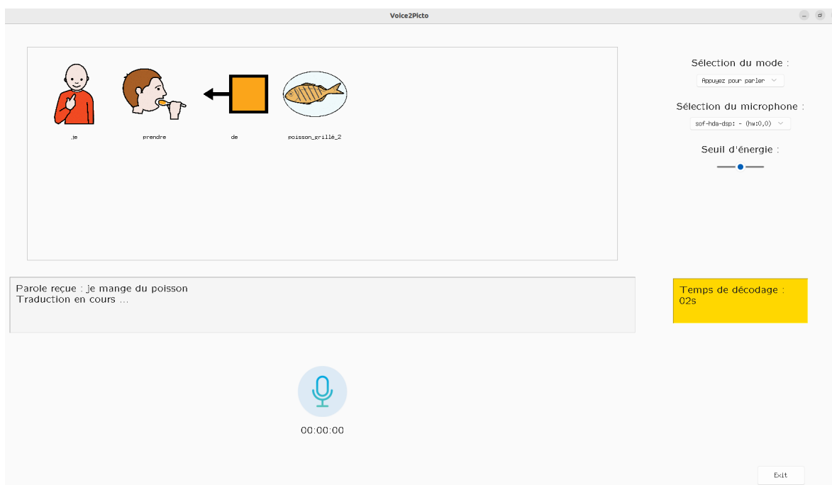
FIGURE 2 – Interface de Voice2Picto.

L'interface de l'application est présentée Figure 2. Elle se veut simple d'utilisation, rapide et ergonomique. Les utilisations possibles sont nombreuses, voire infinies puisqu'elles peuvent rentrer dans de nombreuses situations de la vie quotidienne, telles que communiquer un besoin, une envie, une émotion, raconter une histoire ou poser une question à une personne.