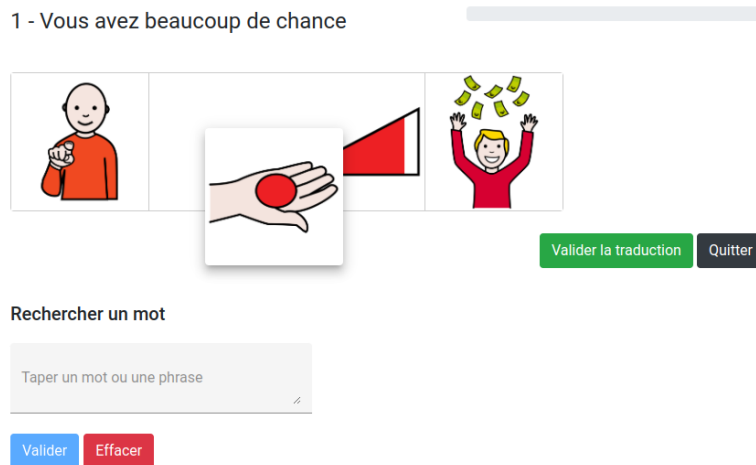
FIGURE 3 – Plateforme PostEditPicto avec vous avez beaucoup de chance comme phrase exemple.

rendre intelligibles (Robert, 2010). Ainsi, ce procédé permet d'évaluer rapidement la qualité des traductions, et de donner des pistes d'amélioration concrètes. De plus, les corrections peuvent servir de référence pour des phrases qui n'ont pas de traduction en pictogrammes, et donc créer des ressources supplémentaires. PostEditPicto permet d'ajouter, de déplacer (par une fonction drag and drop) et de supprimer chaque pictogramme présenté. Une fonction recherche permet de récupérer un mot précis dans la banque Arasaac pour l'ajouter au contenu proposé. L'interface est présentée Figure 3.