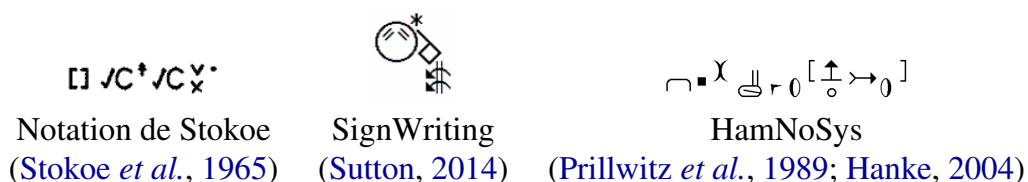
FIGURE 1 – Exemples de représentations graphiques conçues pour les LS.

Le besoin d'une représentation semble pourtant exister. Pour prendre des notes, préparer des supports de discours ou travailler des traductions de manière détachée d'un texte source, les sourds et traducteurs ont régulièrement recours à des "schémas de verbalisation" (fig. 2a), ou VD (pour verbalising diagram ). Ceux-ci mettent en jeu icônes, dessins, lignes et flèches pour les relier... mais ils sont spontanés, à savoir librement composés par leur auteur plutôt que conformes à des règles apprises ou posées a priori. Il n'est donc pas possible de requêter ou interpréter ces dessins pour, par exemple, en synthétiser automatiquement un rendu en LS par un avatar signant.