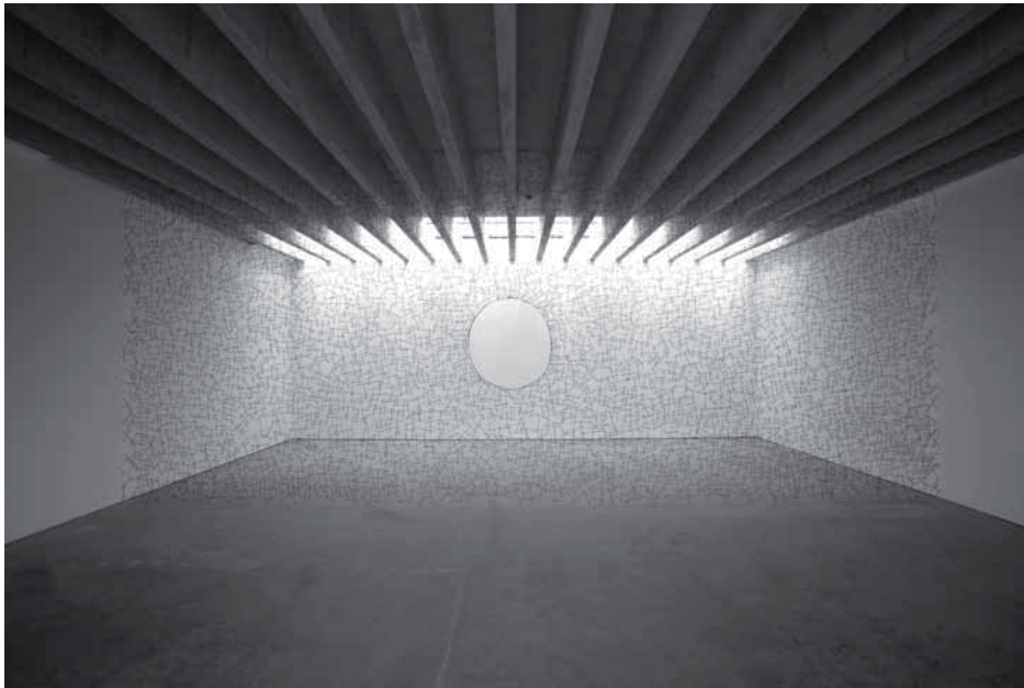
Ci-dessus (ill. 3) Andy Goldsworthy, Leaf Stalk Room , 2007.