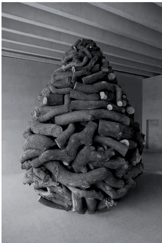
En haut (ill. 1) Vue de l'entrée du Yorkshire Sculpture Park.