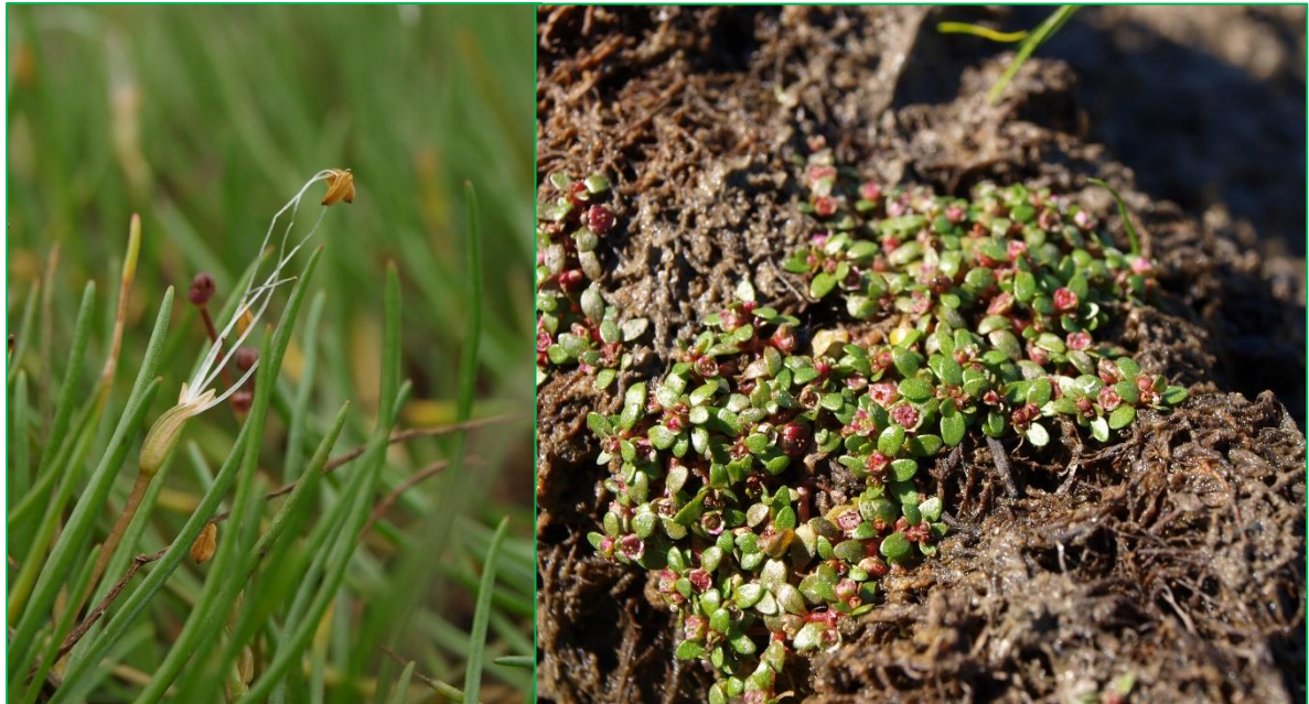
Littorella uniflora (à gauche)