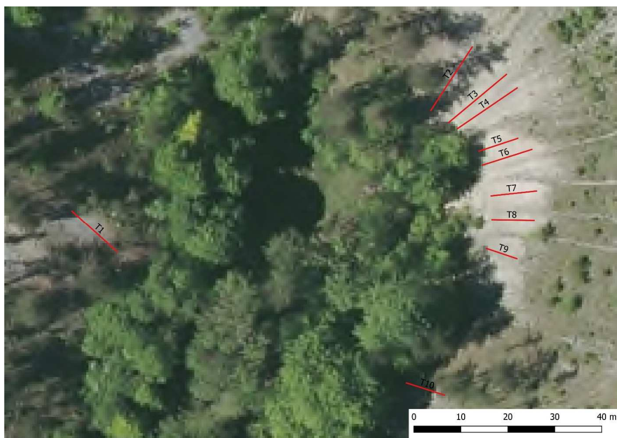
Figure 1 : Localisation des transects

Les transects sont numérotés de 1 à 10 et sont positionné de la manière suivante (figure 8):