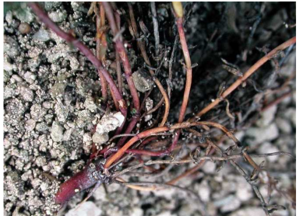
Figure X : Individu probablement biannuel ou pérennant car à forte base

Les conditions climatiques interannuelles variables à l'étage collinéen permettent certainement cette diversité d'expressions.