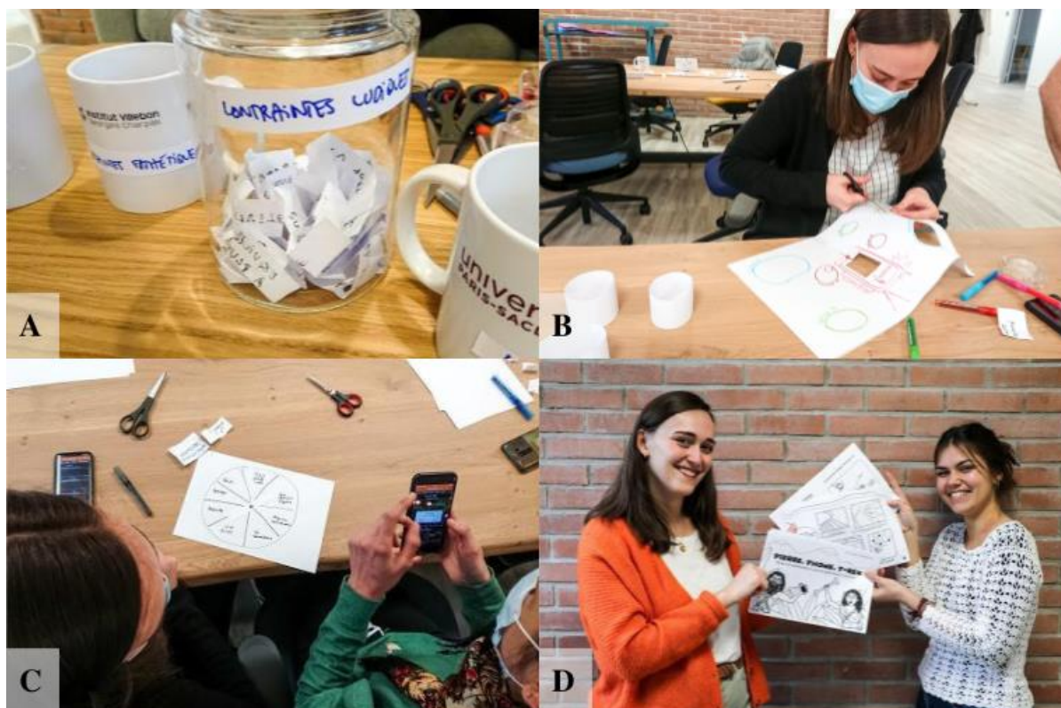
Figure 2 Jeu « Pierre, Phone, T-rex »

à l'équipe permanente en charge du lieu. Le jeu (Figure 2D) a été mis en ligne et relayé sur les réseaux sociaux en mars 2021 ( https://tinyurl.com/pierre-phone-trex ). Il a également été utilisé lors d'un enseignement de physique de L2 en avril 2021 à l'UPSaclay.