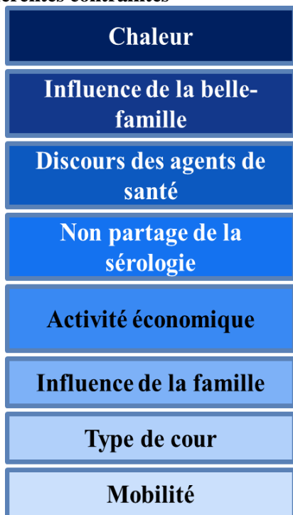
Figure n°1 : Hiérarchisation des différentes contraintes

Au total, dix femmes sur 28 4 ont respecté les exigences de l'allaitement exclusif.