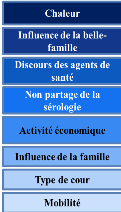
Figure n°1 : Hiérarchisation des différentes contraintes

Au total, dix femmes sur 28 4 ont respecté les exigences de l'allaitement exclusif.