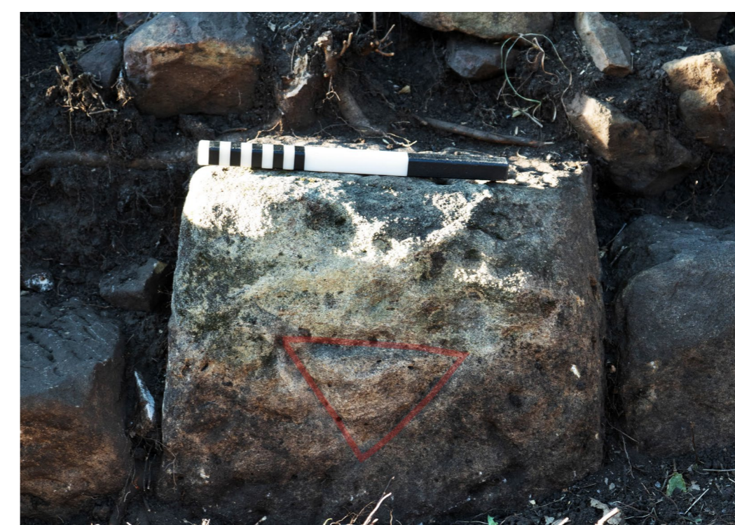
Fig. 2. Sezione orientale del muro sud: delta inciso (capovolto) su blocco in situ (l'aggiunta del colore rosso è degli autori)