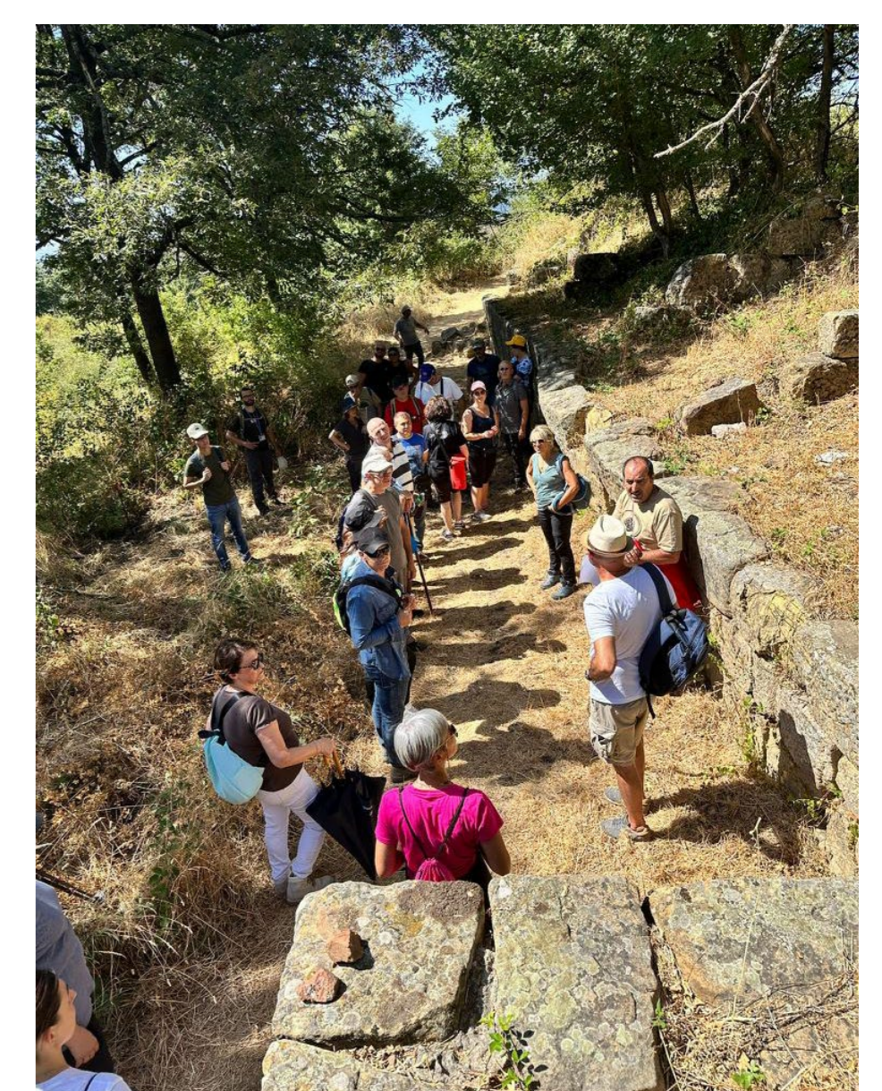
Fig. 5. Visita guidata organizzata dall'associazione 'La Gorgone'.

Aldilà delle ricerche archeologiche sul terreno, il Pietragalla Project è anche un progetto di 'archeologia sostenibile', che mira alla divulgazione dei risultati scientifici presso la comunità locale e alla valorizzazione patrimoniale del sito di Monte Torretta di Pietragalla. In questo ambito abbiamo ricevuto il contributo decisivo dell'associazione locale 'La Gorgone', che ha provveduto alla pulizia del sito in previsione dei lavori archeologici ma anche all'organizzazione di vari 'archeotrekking' a Monte Torretta, con delle visite guidate destinate a sensibilizzare la comunità locale al patrimonio archeologico e forestale del sito (fig. 5). Accanto a queste attività e al fine di trasformare il sito in un vero e proprio parco archeologico (al momento, sia pure sottoposto a vincolo archeologico, l'intero sito insiste su una serie di proprietà private), i funzionari della SABAP della Basilicata stanno procedendo alla perimetrazione dell'area da sottoporre ad esproprio nell'ambito del programma Intervento urgente di restauro conservativo e valorizzazione sostenibile del sito di Monte Torretta di Pietragalla finanziato dal MIBACT (CUP F96J20002110001). La trasformazione dello status giuridico del sito permetterà di avviare finalmente le prime operazioni di scavo sistematico, inaugurando una nuova e decisiva era per il sito di Monte Torretta di Pietragalla.