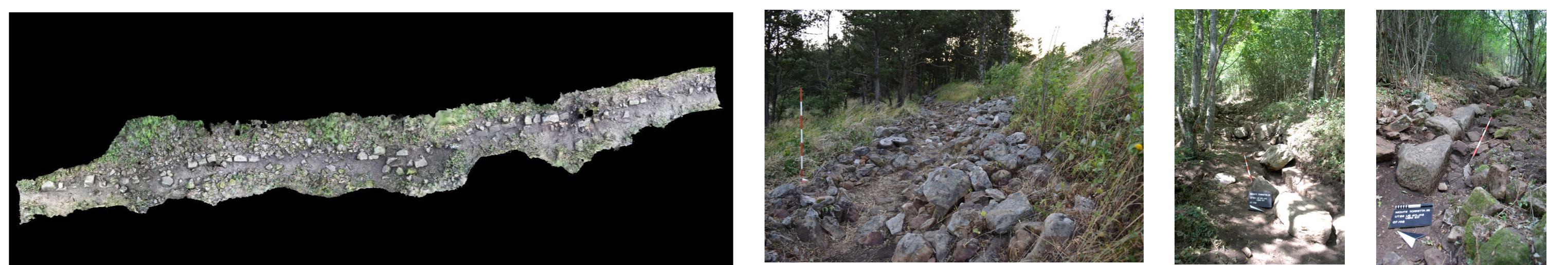
Fig. 1. Localizzazione di Monte Torretta e planimetria del sistema di fortificazione di età ellenistica, con indicazione dei settori indagati nel 2023 (il tratteggio rosso si riferisce ai tratti di mura finora ricostruiti ipoteticamente). In basso, il rilievo fotogrammetrico del tratto sud-est delle fortificazioni e alcune foto di dettaglio dello stato di conservazione attuale.