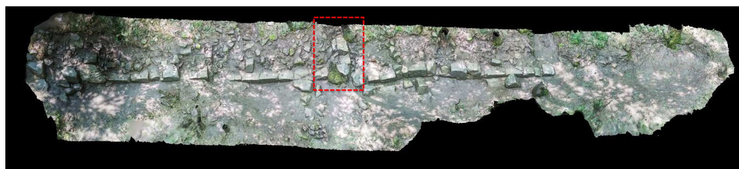
Fig. 4. Rilievo fotogrammetrico deratto nord-est del sistema di fortificazione immediatamente ad ovest della torre Luce: in rosso la catena trasversale