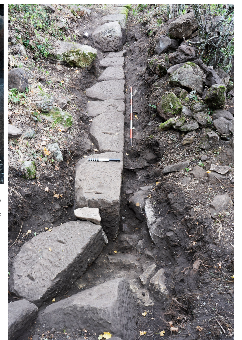
Fig. 3. Tratto sud-est del sistema di fortificazione: cambio di direzione ad angolo ottuso.