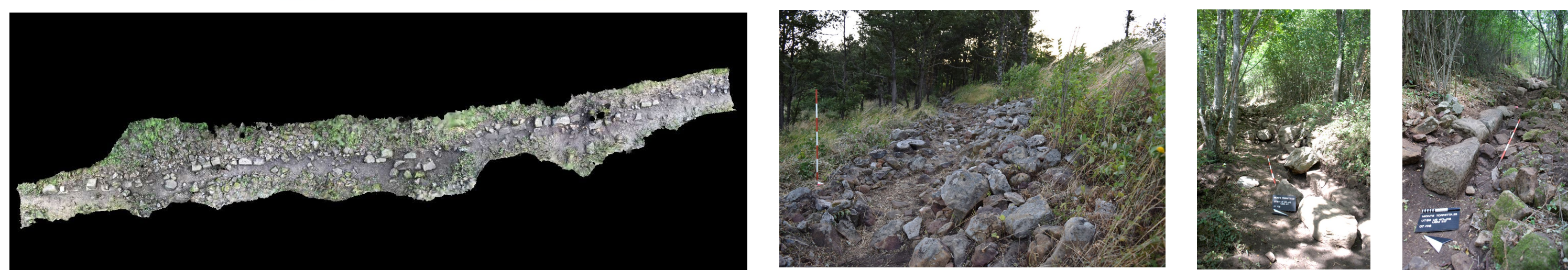
Fig. 1. Localizzazione di Monte Torretta e planimetria del sistema di fortificazione di età ellenistica, con indicazione dei settori indagati nel 2023 (il tratteggio rosso si riferisce ai tratti di mura finora ricostruiti ipoteticamente). In basso, il rilievo fotogrammetrico del tratto sud-est delle fortificazioni e alcune foto di dettaglio dello stato di conservazione attuale.