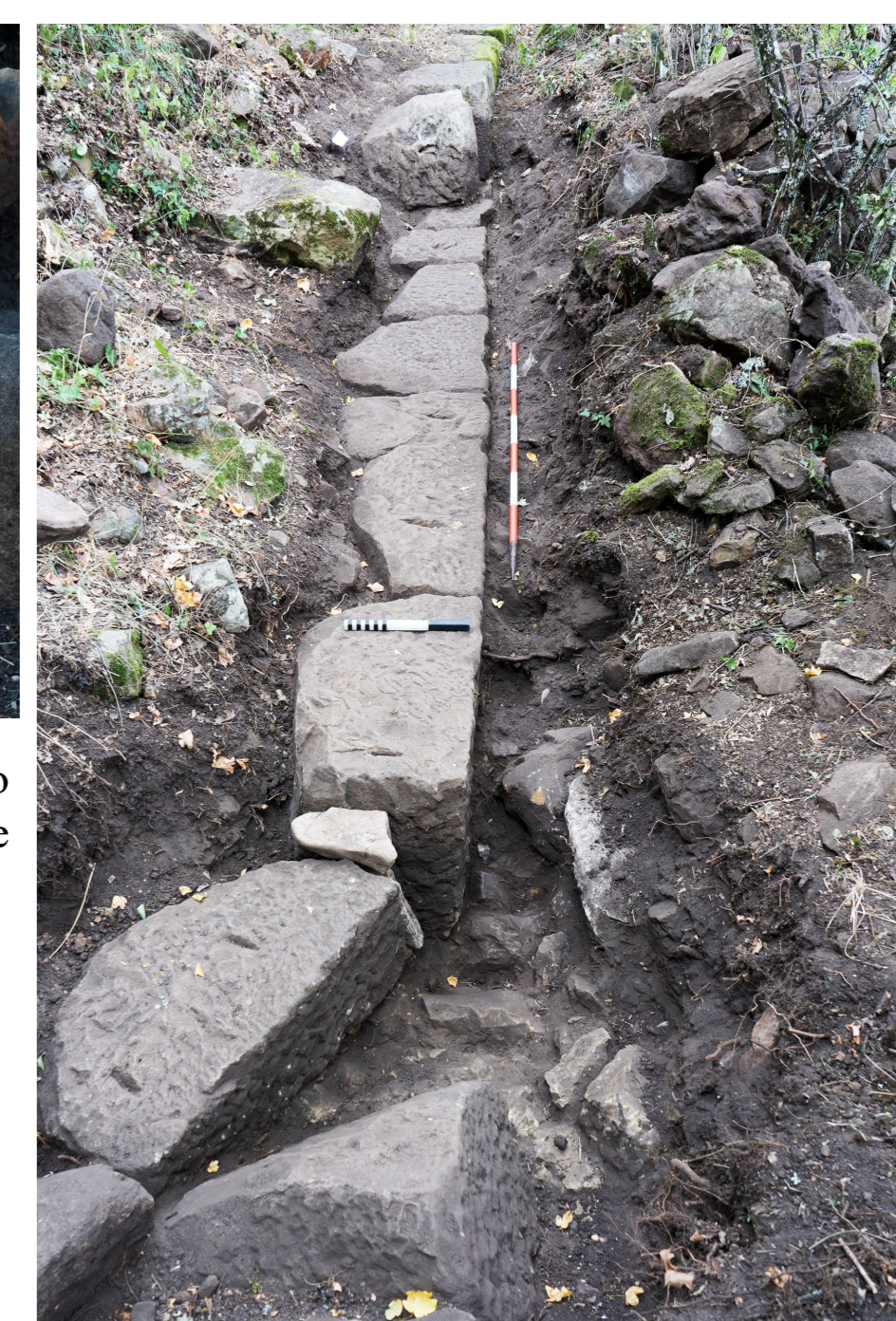
Fig. 3. Tratto sud-est del sistema di fortificazione: cambio di direzione ad angolo ottuso.