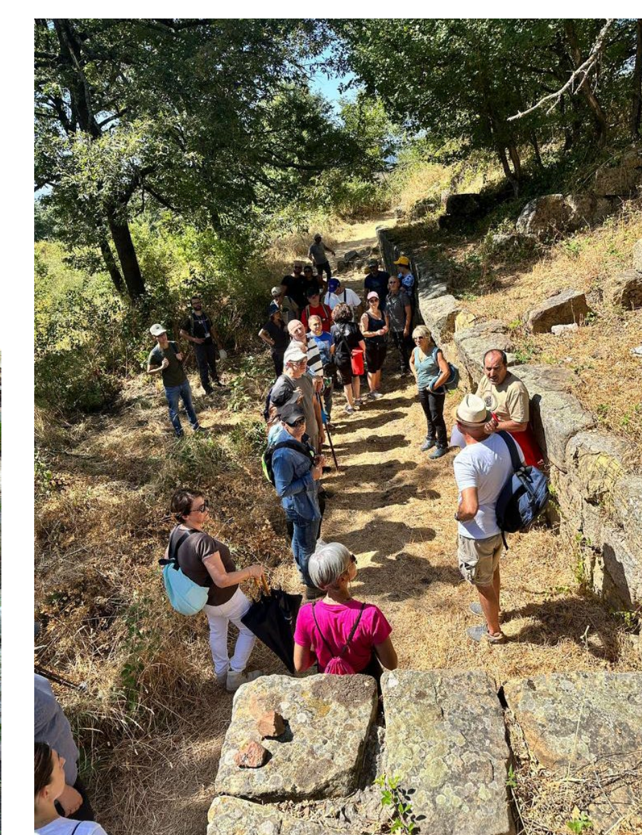
Fig. 5. Visita guidata organizzata dall'associazione 'La Gorgone'.

Aldilà delle ricerche archeologiche sul terreno, il Pietragalla Project è anche un progetto di 'archeologia sostenibile', che mira alla divulgazione dei risultati scientifici presso la comunità locale e alla valorizzazione patrimoniale del sito di Monte Torretta di Pietragalla. In questo ambito abbiamo ricevuto il contributo decisivo dell'associazione locale 'La Gorgone', che ha provveduto alla pulizia del sito in previsione dei lavori archeologici ma anche all'organizzazione di vari 'archeotrekking' a Monte Torretta, con delle visite guidate destinate a sensibilizzare la comunità locale al patrimonio archeologico e forestale del sito (fig. 5). Accanto a queste attività e al fine di trasformare il sito in un vero e proprio parco archeologico (al momento, sia pure sottoposto a vincolo archeologico, l'intero sito insiste su una serie di proprietà private), i funzionari della SABAP della Basilicata stanno procedendo alla perimetrazione dell'area da sottoporre ad esproprio nell'ambito del programma Intervento urgente di restauro conservativo e valorizzazione sostenibile del sito di Monte Torretta di Pietragalla finanziato dal MIBACT (CUP F96J20002110001). La trasformazione dello status giuridico del sito permetterà di avviare finalmente le prime operazioni di scavo sistematico, inaugurando una nuova e decisiva era per il sito di Monte Torretta di Pietragalla.