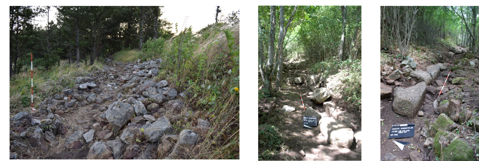
Fig. 1. Localizzazione di Monte Torretta e planimetria del sistema di fortificazione di età ellenistica, con indicazione dei settori indagati nel 2023 (il tratteggio rosso si riferisce ai tratti di mura finora ricostruiti ipoteticamente). In basso, il rilievo fotogrammetrico del tratto sud-est delle fortificazioni e alcune foto di dettaglio dello stato di conservazione attuale.