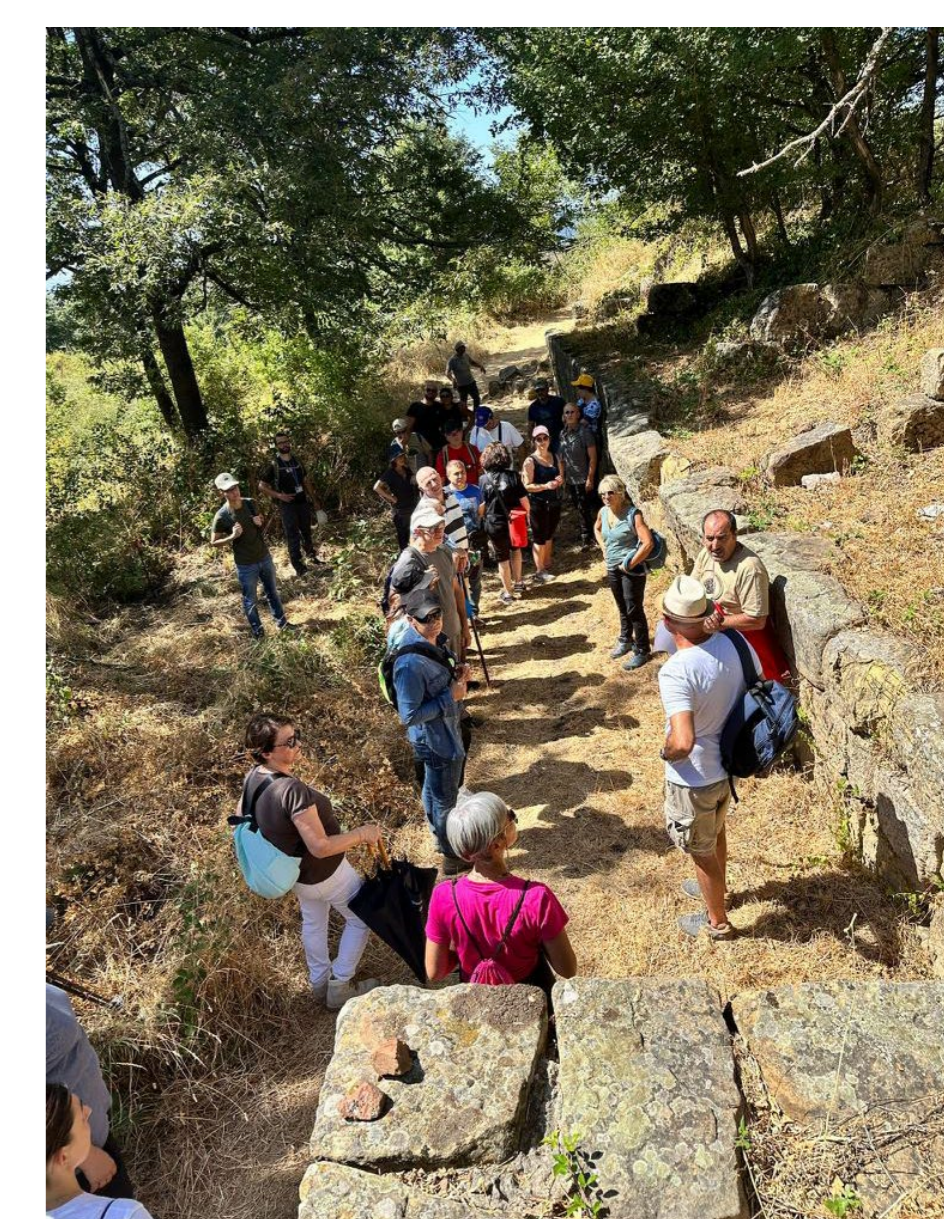
Fig. 5. Visita guidata organizzata dall'associazione 'La Gorgone'.

Aldilà delle ricerche archeologiche sul terreno, il Pietragalla Project è anche un progetto di 'archeologia sostenibile', che mira alla divulgazione dei risultati scientifici presso la comunità locale e alla valorizzazione patrimoniale del sito di Monte Torretta di Pietragalla. In questo ambito abbiamo ricevuto il contributo decisivo dell'associazione locale 'La Gorgone', che ha provveduto alla pulizia del sito in previsione dei lavori archeologici ma anche all'organizzazione di vari 'archeotrekking' a Monte Torretta, con delle visite guidate destinate a sensibilizzare la comunità locale al patrimonio archeologico e forestale del sito (fig. 5). Accanto a queste attività e al fine di trasformare il sito in un vero e proprio parco archeologico (al momento, sia pure sottoposto a vincolo archeologico, l'intero sito insiste su una serie di proprietà private), i funzionari della SABAP della Basilicata stanno procedendo alla perimetrazione dell'area da sottoporre ad esproprio nell'ambito del programma Intervento urgente di restauro conservativo e valorizzazione sostenibile del sito di Monte Torretta di Pietragalla finanziato dal MIBACT (CUP F96J20002110001). La trasformazione dello status giuridico del sito permetterà di avviare finalmente le prime operazioni di scavo sistematico, inaugurando una nuova e decisiva era per il sito di Monte Torretta di Pietragalla.