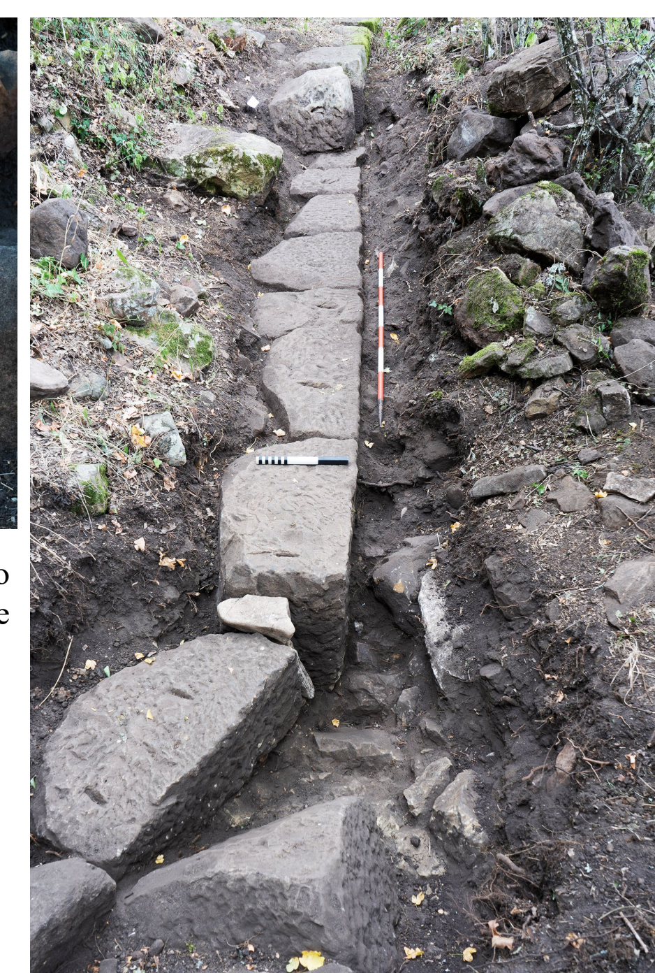
Fig. 3. Tratto sud-est del sistema di fortificazione: cambio di direzione ad angolo ottuso.