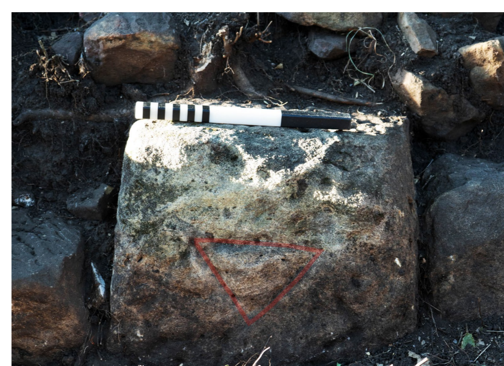
Fig. 2. Sezione orientale del muro sud: delta inciso (capovolto) su blocco in situ (l'aggiunta del colore rosso è degli autori)