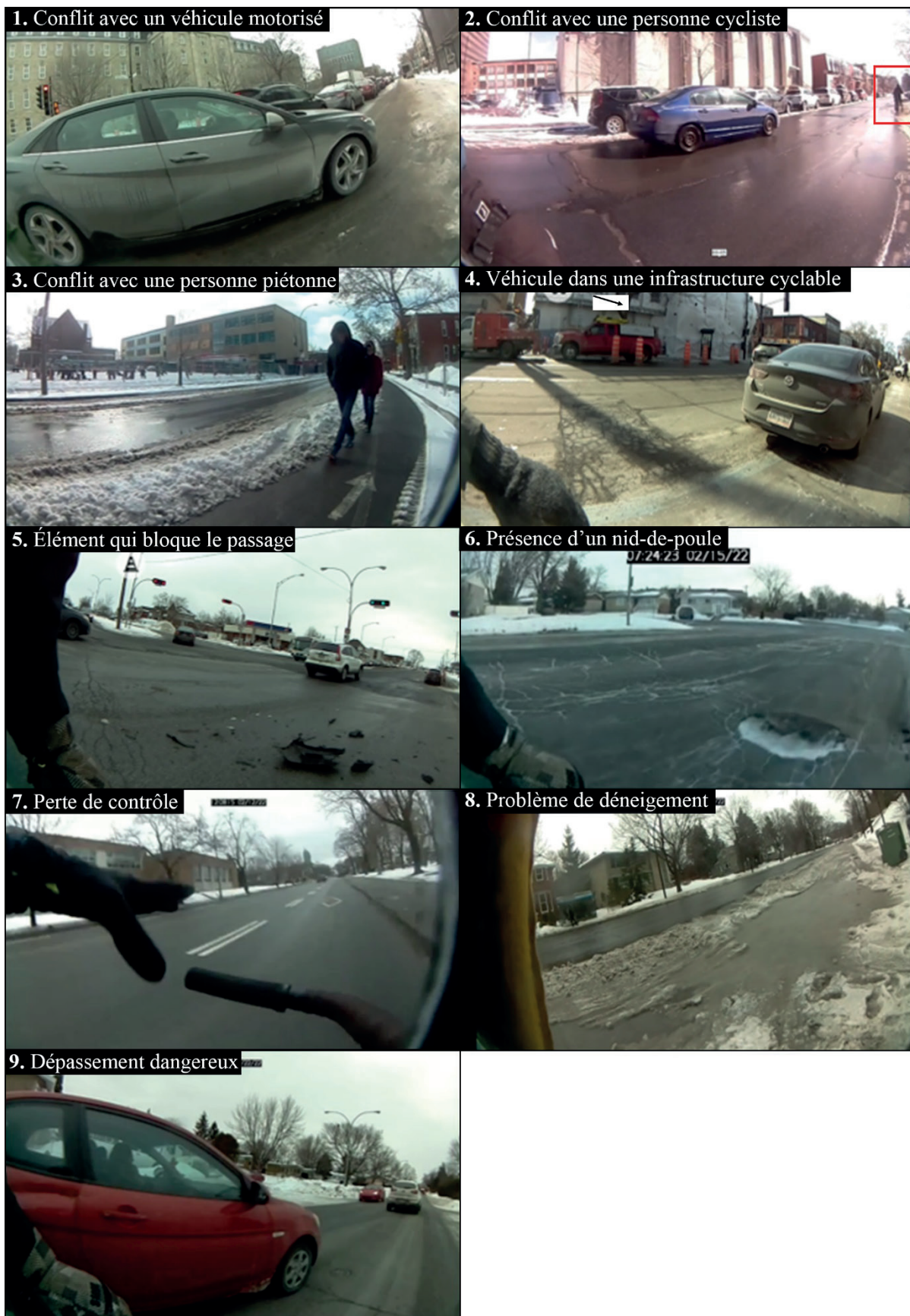
Fig. 3. Captures vidéo des neuf types de risques