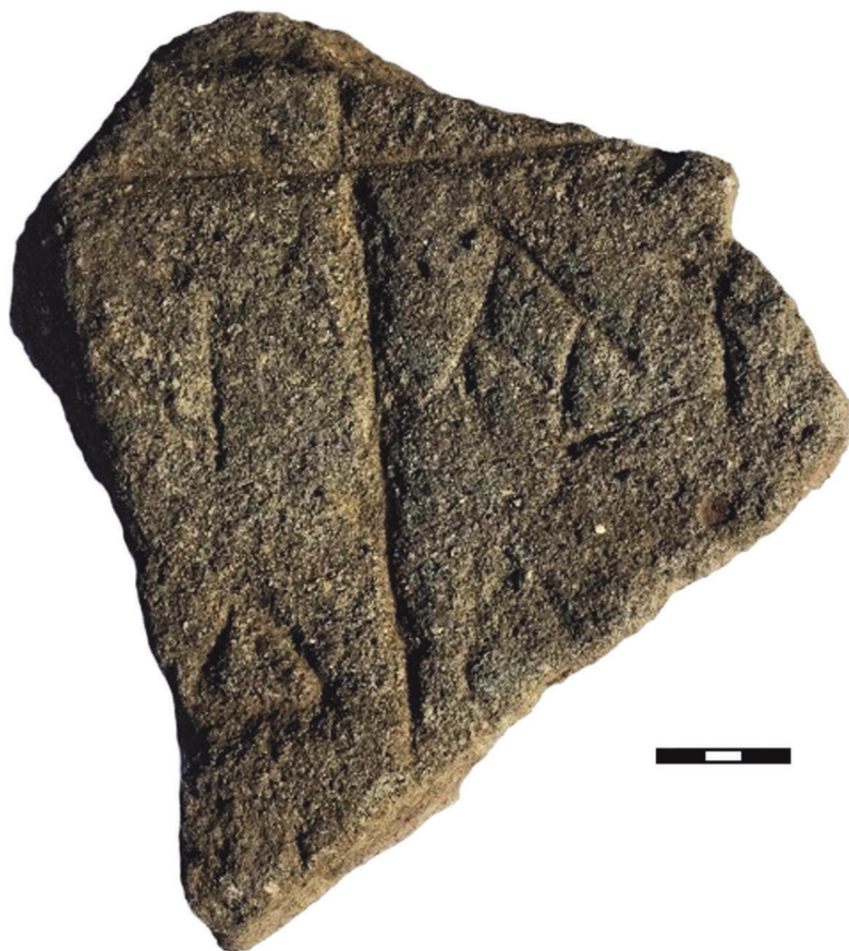
Рис. 1. Горзувиты. Фрагмент каменного надгробия.

похожая на треугольную «Λ» или «Δ», написанная вплотную к «Α», под ними черта, возможно – это не относящееся к надписи повреждение камня. Под ней можно заметить остатки буквы, у которой две гасы вверху соединены под углом, а нижняя часть утрачена, как и возможная боковая, что делает ее похожей на маюскульные Μ, Ν или Λ.