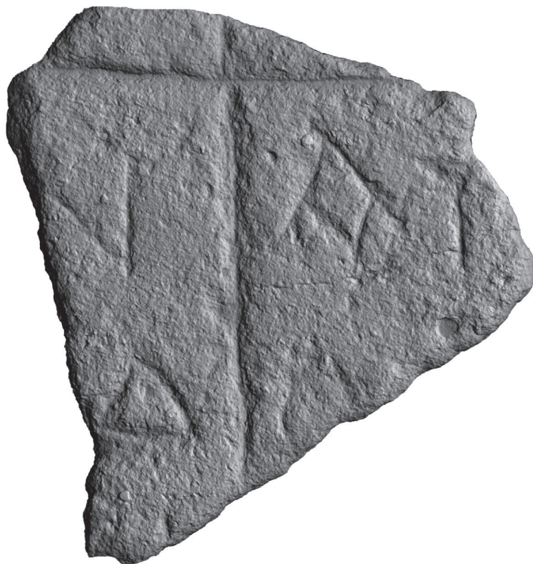
Рис. 3. Горзувиты. Фрагмент каменного надгробия

Растровый рендер матрицы высот, построенной на основе трехмерной полигональной модели. Цвет определяется расстоянием от поверхности с надписью до произвольно заданной поверхности, параллельной поверхности с надписью, вариант визуализации «градиент оттенков серого»