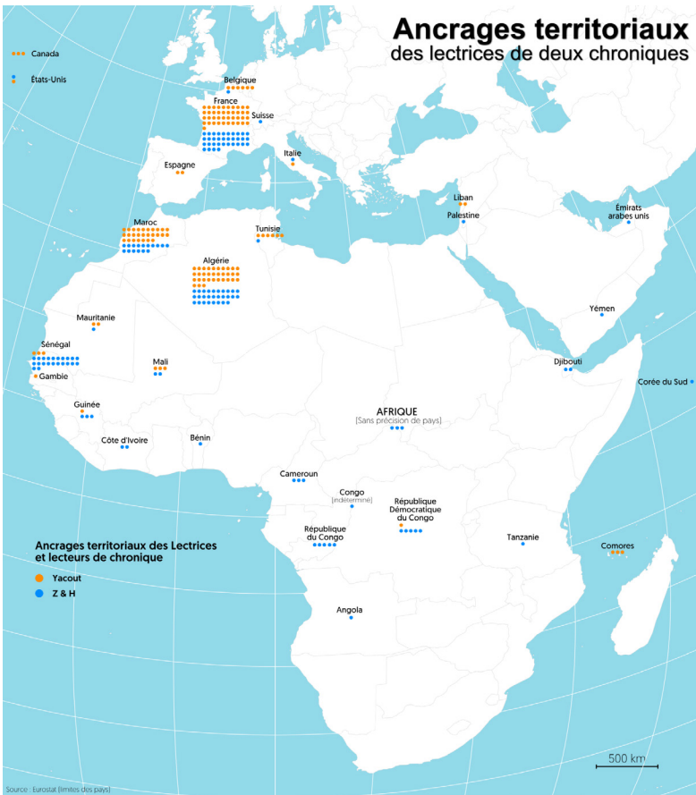
Figure 3. Ancrages territoriaux des lectrices des deux chroniques

données qui permettaient aux lectrices de construire une identité territorialement ancrée. Nous avons étudié les profils des lectrices de chacune des chroniques jusqu'à en avoir 100 dont l'identité construite s'ancre dans un ou plusieurs territoires 37 . Dans les 200 profils territorialisés, nous avons relevé toutes les références à des lieux. Pour pouvoir cartographier ces lieux, nous avons dû procéder à une simplification et nous avons rattaché les dénominations de lieu à un pays. Ainsi, Soniaaaa, lectrice de Z & H ancre son profil au Maroc avec les informations suivantes :