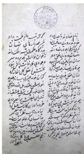
Auteur inconnu, Fath-Namah (Le Livre de la victoire) Crédit : Biblioteca Estense Modena, Ms.V.F.6. 22, 1622, fol. 2v.