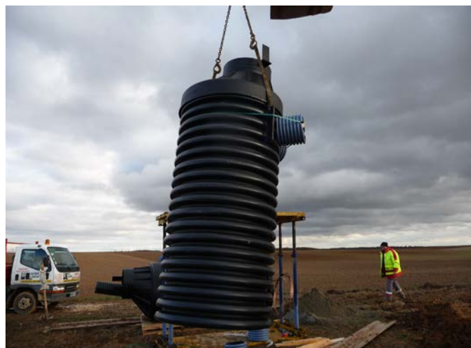
Figure 3 : installation de l'un des prototypes de puits sismique sur le site de Clévilliers (Eure et Loir) en novembre 2012.

bâties sur une zone de test située au nord de Chartres (Figure 3). Nous recherchons la structure qui permet de minimiser le niveau de bruit sismique tout en assurant une bonne protection et accessibilité des instruments installés. D'autre part, nous testons la mise en œuvre d'armoires de supervision basées sur des automates programmables industriels et différents capteurs d'état, qui permettent de suivre le fonctionnement des nombreux équipements installés sur chaque site. Ce système permet également d'intervenir à distance sur ces équipements, manuellement ou automatiquement, évitant ainsi au personnel une partie des déplacements sur place. Un tel prototype, construit à l'OHP, est actuellement en test à une station large-bande située dans le Jura (CHMF).