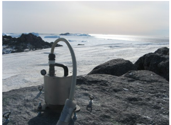
Figure 1. Capteur d'une station SISMOB en Terre Adélie (expérience Arlita-sis )

Les objectifs scientifiques de SISMOB sont ceux des expériences qui utilisent son matériel. Ainsi, nous veillons à ce que la dynamique des numériseurs, la bande passante des capteurs, le nombre de voies des enregistreurs ou l'autonomie des stations couvrent au mieux les besoins des divers domaines d'application de la sismologie expérimentale.