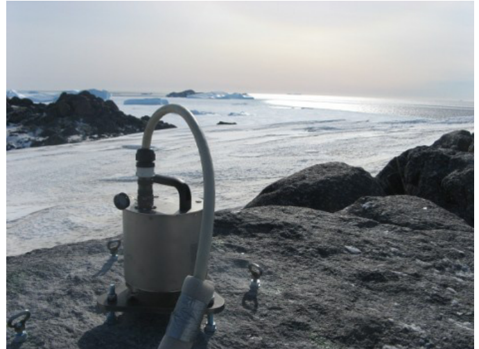
Figure 1. Capteur d'une station SISMOB en Terre Adélie (expérience Arlita-sis )

Les objectifs scientifiques de SISMOB sont ceux des expériences qui utilisent son matériel. Ainsi, nous veillons à ce que la dynamique des numériseurs, la bande passante des capteurs, le nombre de voies des enregistreurs ou l'autonomie des stations couvrent au mieux les besoins des divers domaines d'application de la sismologie expérimentale.