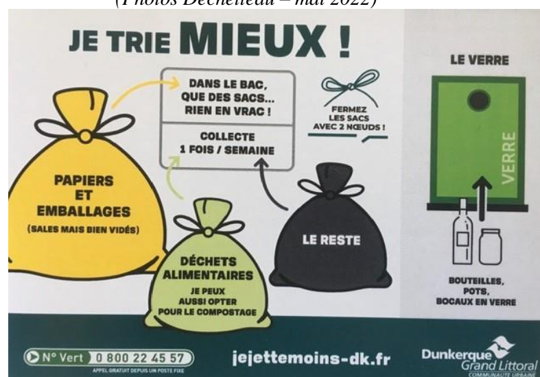
Image 3 : Un des flyers de la nouvelle consigne de tri sélectif des déchets avec des sacs poubelles

Au contraire, 1/3 (environ 32%) considère que la question des sacs constitue « ce qu'ils n'aiment pas » dans ce changement à cause de leur matière plastique. Pour ces derniers, il apparaît contradictoire de déclarer vouloir diminuer le volume des déchets ultimes alors que la multiplication des sacs va augmenter le volume du déchet qui apparaît comme le plus nocif : le plastique.