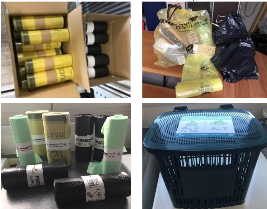
Image 2 : Les nouveaux sacs de tri et un bio-seau gratuits de la CUD

Parce qu'elle vise à offrir les moyens d'agir plutôt qu'à contraindre par des instruments réglementaires, la mesure de gratuité des récipients pour la pratique du tri sélectif à la source rappelle le constat dressé par O. Leclerc et T. Sachs qui, dans leur étude sur le développement d'une logique incitative en droit du travail, indiquent qu'« une faveur nouvelle est aujourd'hui affichée au profit d'instruments de gouvernement des hommes qui encouragent, plutôt qu'ils ne contraignent » (2015 :172) ou S. Cottin-Marx (2019) qui analyse la diffusion de ce qu'il appelle le « gouvernement par l'accompagnement » dans le monde associatif. Ces constats du développement d'une logique incitative dans les modes d'intervention de la puissance publique semblent d'ailleurs plus marqués dans le domaine particulier des politiques en matière environnementale (Halpern et Le Galès, 2011 ; Baudu, 2012 ; Bontemps et Rotillon, 2007).