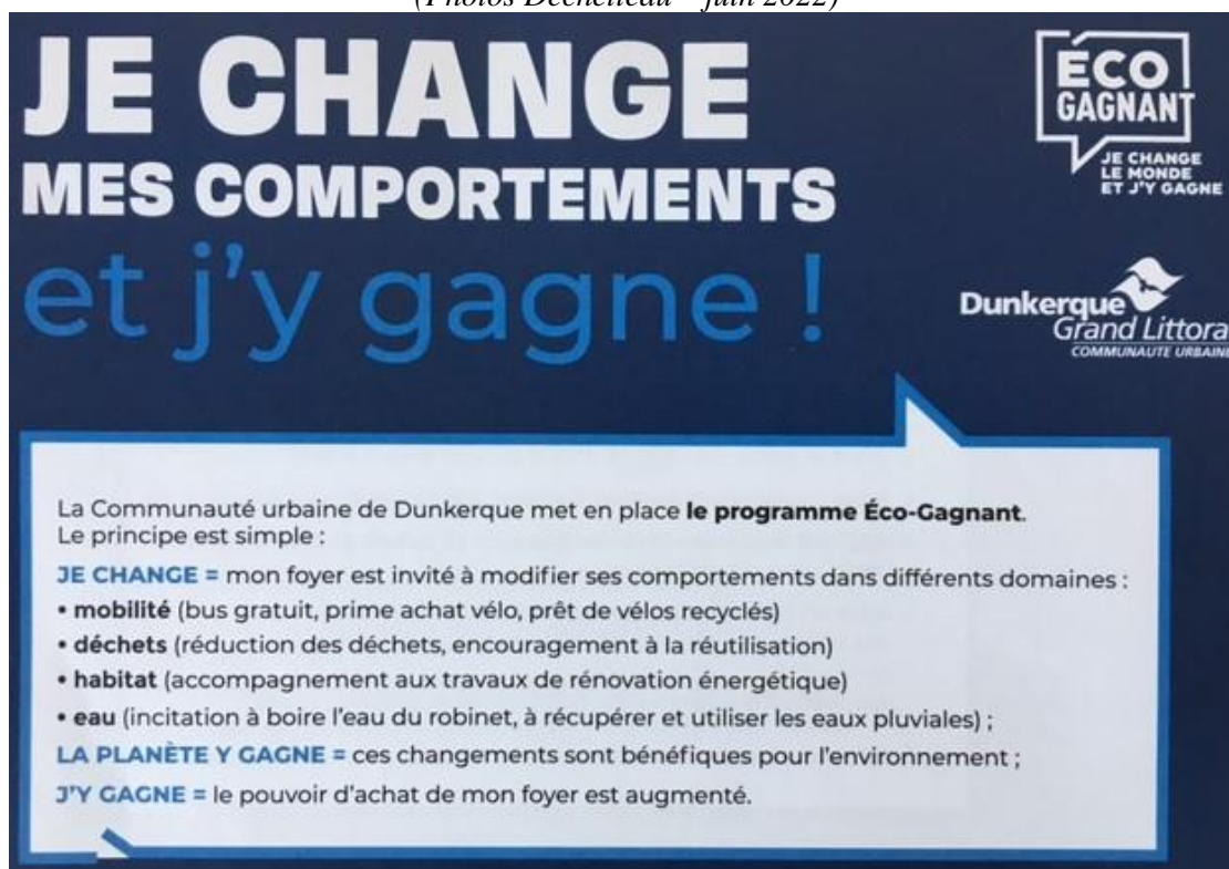
Image 1 : Aperçu d'un des dépliants du programme Éco-Gagnant de la CUD

Concernant la gestion des déchets plus précisément, la stratégie du programme Éco-Gagnant se traduit, effectivement, par une offre de divers nouveaux services totalement ou partiellement gratuits comme le ramassage spécial des encombrants, le broyage des végétaux à domicile ou les aides pour l'acquisition d'un équipement de mulching (pour la tonte de pelouse). La mise en place de ces services poursuit comme objectif commun l'incitation et l'accompagnement des changements de comportements des habitants.