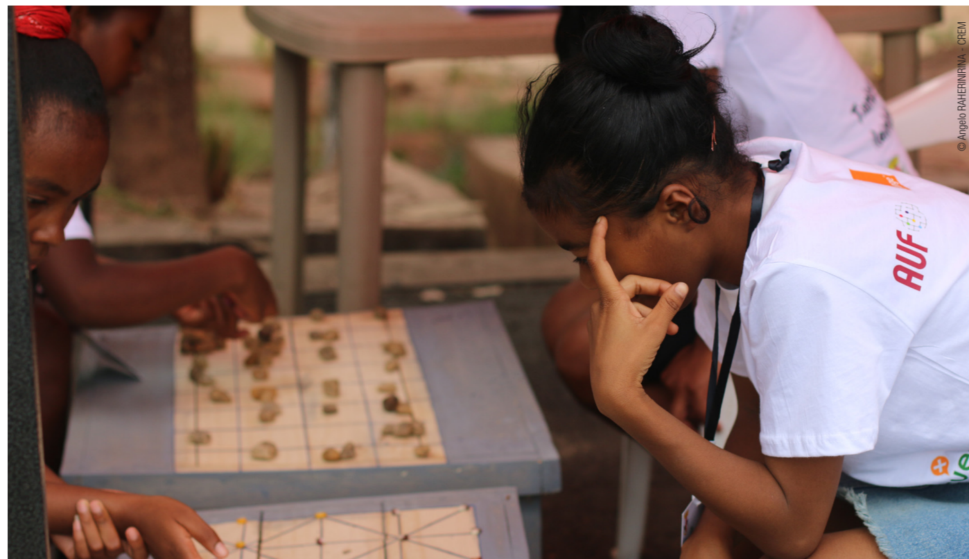
Jeu de Fanorona à Madagascar.