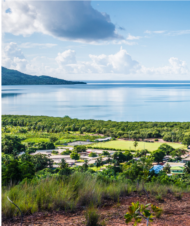
Loin des panoramas idylliques, Mayotte est sujette à des problématiques d'accès à l'eau et aux soins.

L'île de Mayotte, département le plus jeune de France, doit faire face à l'épidémie du Covid sans compter deux autres épidémies signalées. C'est dans ce contexte d'urgence sanitaire que les mathématiciens du Laboratoire Mathématiques et Applications à Poitiers créent des outils de modélisation pour apporter des solutions non pharmaceutiques efficaces.