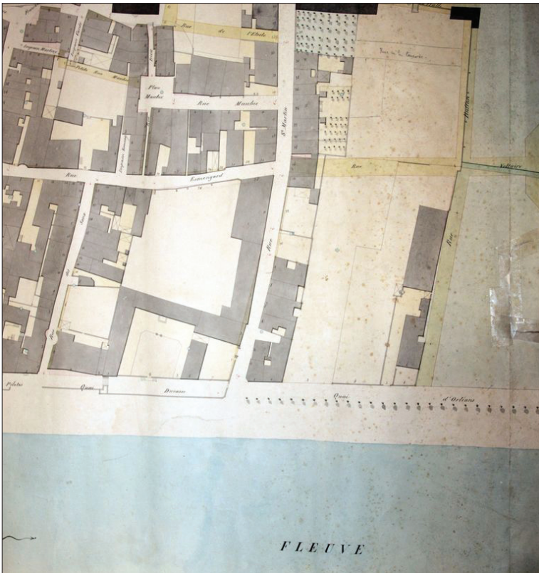
Fig. 3. Détail du plan de la Ville de Pauillac (feuille 3), 1835.