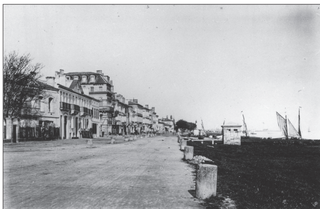
Fig. 5. Photographie des quais de Pauillac, publiée par J. Stoerk, 1868.