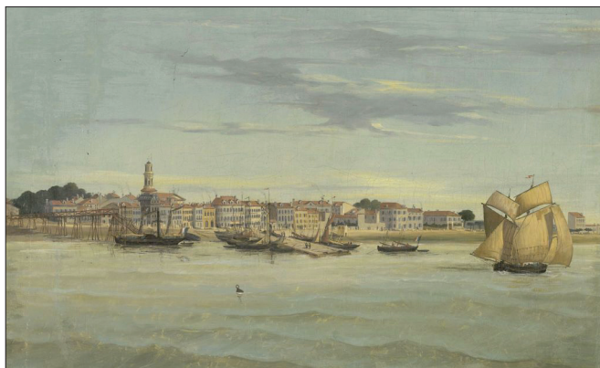
Fig. 4. Tableau des quais de Pauillac, 2 e moitié du XIX e siècle.