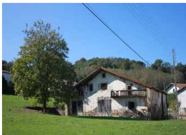
Maison paysanne Irari, quartier de Germetia

foyers constituait un habitat dispersé. Le phénomène de dispersion, que l'on remarque nettement à l'Époque Moderne, serait donc dû à une évolution de l'occupation du sol postérieure au Moyen Âge. En outre, l'analyse des catégories indique que les agglomérations étaient notamment constituées de maisons roturières (82 %). Le nombre de maisons roturières et de maisons nobles en habitat dispersé est quant à lui beaucoup plus équilibré (neuf roturières et treize nobles). La tendance des nobles est bien différente de celle des paysans : seule la moitié des maisons nobles se situe dans un hameau, pour 86 % des maisons de laboureurs. Par conséquent, l'habitat groupé est notamment soutenu par le groupe des paysans, mais il faut tenir compte de leur supériorité numérique.