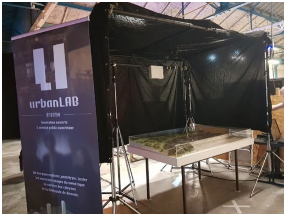
Figure 2. Dispositif installé en 2020 avec le soutien de l’Urban Lab d’Erasmus, Métropole de Lyon : maquette matérielle, dispositif de projection et caméra, boîte noire.