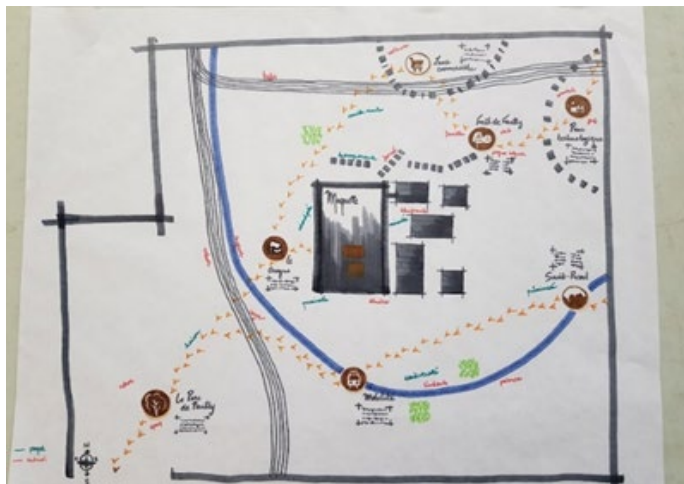
Figure 6. Les étudiant.es ont aussi apporté de nouvelles formes de médiation en matérialisant physiquement un parcours autour de la maquette.

matérielle de la Maison du projet, à l'expérience vécue de la ville par la déambulation urbaine, à la multiplicité des sources de données collectées, compilées, etc.