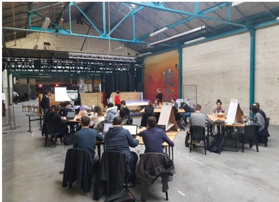
Figure 4. Halles du Faubourg, au cœur du festival « A l'École de l'Anthropocène » de l'École urbaine de Lyon, 2019.

Au fur et à mesure, l'utilisation des dispositifs a progressé. Parallèlement au changement des terrains d'étude nous nous sommes efforcés de faire évoluer les modes de représentation du territoire et les échelles, allant du bâtiment à un campus en passant par le quartier. C'est pourquoi un nouveau dispositif a été proposé chaque année, comme on peut le constater dans la dernière colonne du tableau en Figure 5 : le caractère nomade du projet nécessite de changer de maquette de référence et de thématique.