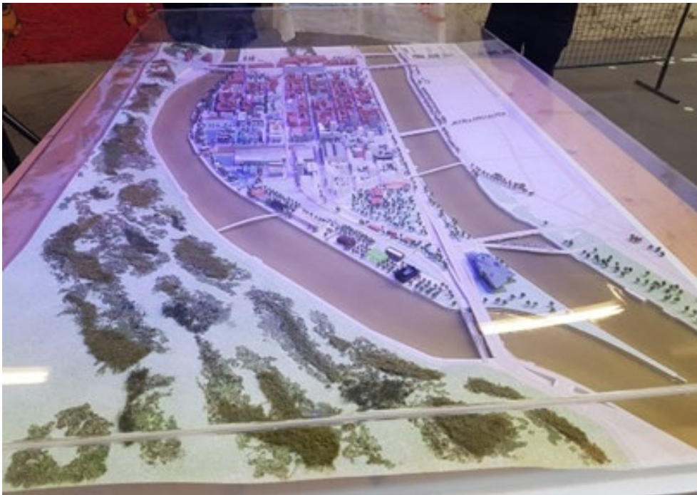
Figure 1. Maquette physique SPL Confluence, échelle 1/750, 2000.

Les projets urbains nécessitent la mise en œuvre de plans d'actions de communication et de médiation particulièrement sophistiqués, et la réalisation de nombreux documents, rapports, études et autres qui constituent autant de manières de représenter, mettre en récit ou en débat les visées transformatrices du projet pour la ville et ses habitants (Figure 1). Pendant longtemps, les maquettes n'ont existé que sous une forme matérielle. On peut remonter aux plans-reliefs des villes fortifiées par Vauban présentés à Louis XIV dans la Galerie des Glaces de Versailles, ou simplement se référer à n'importe quelle maquette d'immeuble résidentiel exposé dans le bureau de vente d'un promoteur.