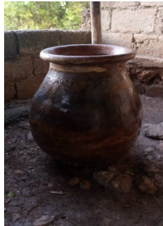
Un jarre haïtien

sance 17 (des cultures pour elles-mêmes, des cosmovisions, des responsabilités, des droits à la vie, à la différence, à la régénération, à la réparation ; du droit à la liberté de modification, etc., Damus, 2021) en tant que finalité ou valeur fondamentale de l'éducation est insuffisante si elle n'est pas suivie de mesures de compensation 18 du passé et du présent. Par exemple, les entreprises spécialisées dans la fabrication et la vente du caoutchouc naturel et synthétique peuvent investir une partie de leur masse salariale dans la protection des peuples indigènes, notamment les Indiens d'Amazonie dont les savoirs ont joué un rôle de premier plan dans la conservation de leur forêt dont on sait qu'elle représente le poumon de la planète. Il faut reconnaître qu'en matière de préservation de l'environnement, les paysans et les autochtones sont « peut-être plus modernes dans leurs enseignements traditionnels que tous les enseignements modernes ».