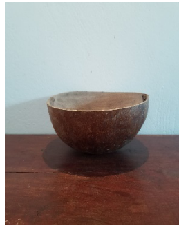
Un coui haïtien