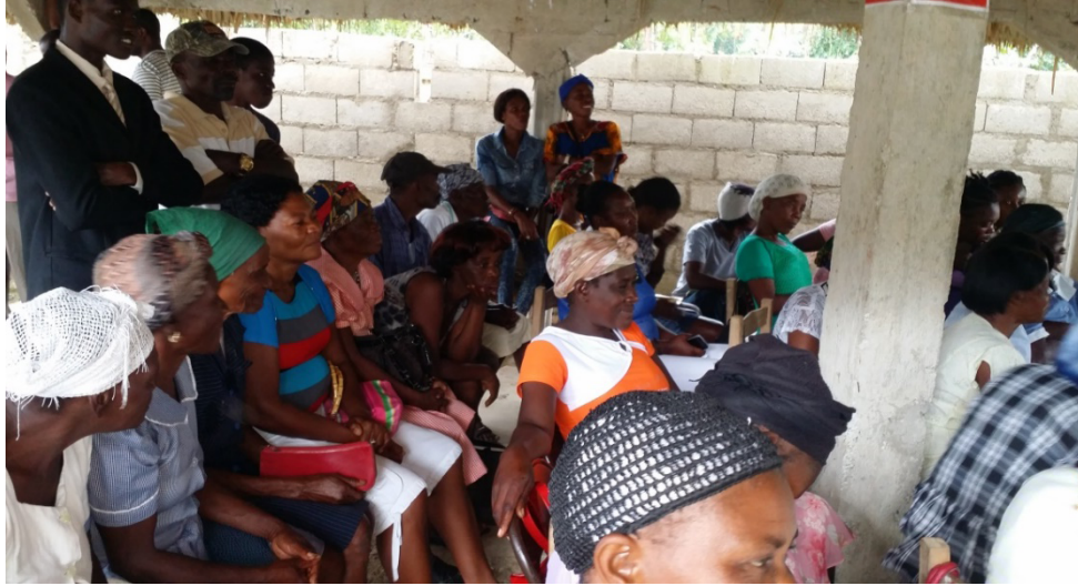
Fig. 1 - Participants in the local dialogue workshop held in Jean-Rabel (Haiti) on November 26 and 27, 2016.