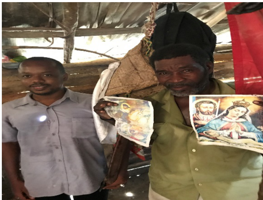
Ce médecin traditionnel haïtien (à droite de la photo) m'a montré des photos de saints lors d'une visite dans son sanctuaire

Les guérisseurs n'utilisent pas seulement des noms de saints et de saintes mais aussi des images hagiographiques imprimées. Si celles-ci ne font pas qu'embellir le mur de leur badji 15 auquel elles sont accrochées, c'est parce qu'elles ne sont pas dépourvues de pouvoir ou d'efficacité symbolique (Freedberg, 1989). Les images magiques et religieuses observées servent de points d'appui à leurs pratiques discursives.