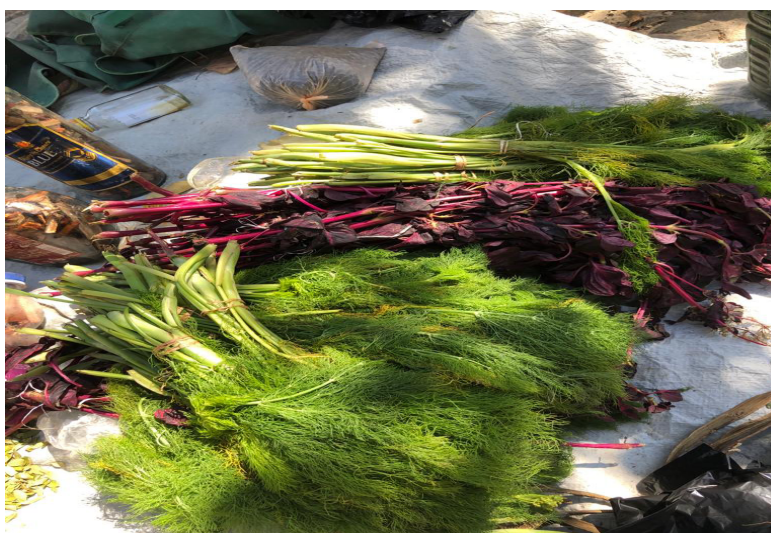
Photo de quelques plantes utilisées dans la préparation du bebelis.

les mois. C'est la raison pour laquelle elles prennent un bebelis pour faire revenir le sang. Quand elles prennent des pilules contraceptives, elles ne consomment pas ce médicament pour faire revenir leurs règles, car celles-ci continuent d'apparaître chaque mois. Dans la mentalité haïtienne, si les règles ne viennent pas chaque mois, les femmes pensent que celles-ci sont allées se cache r. Les contraceptifs peuvent faire cesser les règles en bloquant l'ovulation. Pour qu'une femme puisse ovuler chaque mois, elle doit avoir ses règles. Dès lors qu'elle n'a pas besoin de tomber enceinte, ses règles peuvent être bloquées. Quand on explique cela à certaines femmes, elles cessent de s'inquiéter de l'absence du sang menstruel. Mais d'autres souhaitent voir l'écoulement des règles tous les mois.