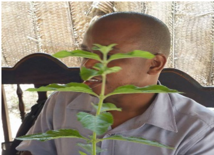
Fig. 2- An aromatic plant held by the facilitator of the 2016 dialogue workshop. Its local name is senjozèf .

Material poverty prevents many matrons from observing certain rules of hygiene. One matron had contracted HIV during her job. Since she exercises her profession gratis pro communis, she deserves to be helped.