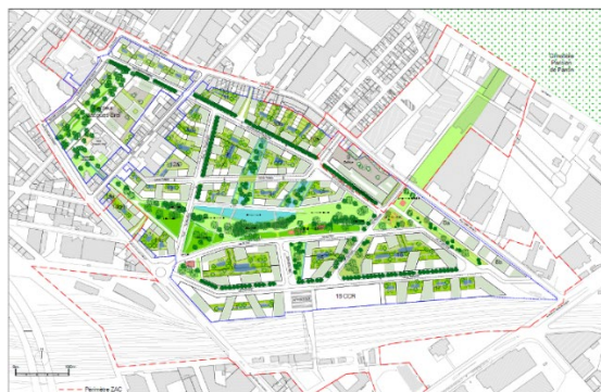
Figure 1 : Plan guide de l'« Ecoquartier de la gare » à Pantin

L'« Écoquartier de la gare » à Pantin (93) est une zone d'aménagement de 45 ha, située aux portes de Paris. En 2013, lors de l'élaboration du dossier de création de la ZAC, Est Ensemble et la Ville de Pantin affichent leur volonté de mener un projet exemplaire, avec un engagement fort en matière de développement durable. La ZAC doit comprendre une forte proportion d'espaces verts et l'objectif visé initialement pour la gestion des eaux pluviales sur la ZAC est le « zéro rejet », c'est-à-dire la gestion à la source de la totalité des eaux pluviales, en priorité par infiltration. Il est ainsi prévu de rediriger les eaux pluviales des espaces publics et des espaces privés vers un bassin d'infiltration situé dans un espace vert au centre de la ZAC (Figure 1).