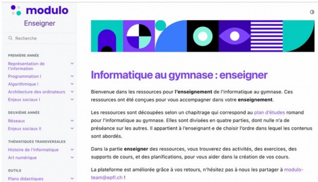
Figure 3: Page d'accueil de la partie "Enseigner" destinée aux enseignant.es.

complexes (e.g. « diviser pour régner ») qui figurent au plan d'études.