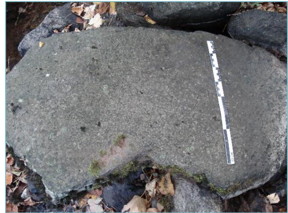
Fig. 5 – Fragment de meule retrouvé dans le lit du ruisseau de Bellecombe (43), en bordure du clos monastique

Ainsi, l'ethnographie, au risque d'interprétations anachroniques, demeure une nécessité méthodologique : l'observation de modestes complexes meuniers des deux siècles derniers, dont les vestiges sont encore intelligibles, permet de comprendre bâtiments et équipements dans leur spécificités architecturales et techniques. Ces références locales autorisent dans une certaine mesure la reconnaissance et la compréhension de vestiges plus anciens, que l'abandon de longue date et la végétation souvent abondante avaient menés à la quasi-destruction et à l'oubli.