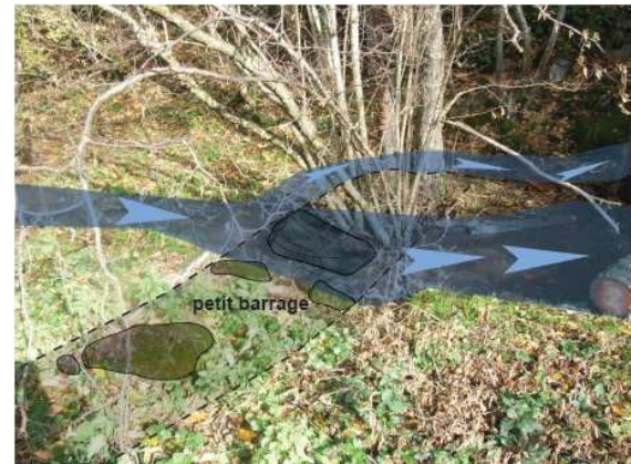
Fig. 3 – Petits aménagements de cours d'eau : dérivation pour le bief d'un moulin, site de l'abbaye de Mègemont (63)

que d'autres, qui semblent appartenir à un système fonctionnellement relié au site monastique. Les moulins seront les plus faciles à repérer et à qualifier encore qu'en fonction de leur état de conservation, souvent médiocre, il sera difficile d'en déterminer la fonction (à farine, à huile, à foulon, à tan, scies hydrauliques, marteaux hydraulique, fig. 4 ).