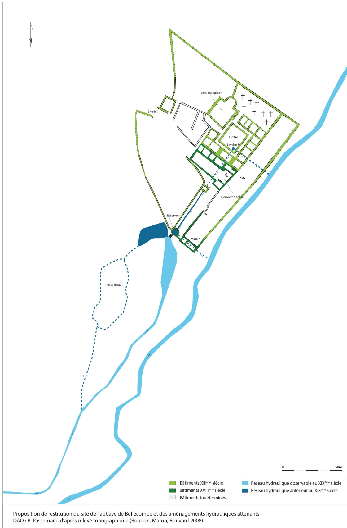
Fig. 7 – Restitution topographique du complexe conventuel de l'abbaye de Bellecombe (Moyen Âge et époque moderne)

Réalisation : E. Bouvard-Mor / Blandine Passemar / Patrick Boudon