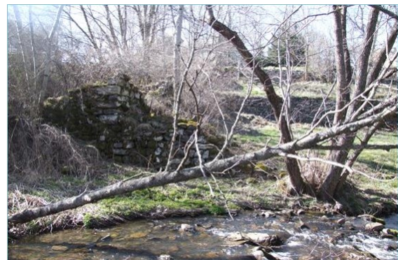
Fig. 4 – Ruine du moulin de l'abbaye de Bellecombe (43)