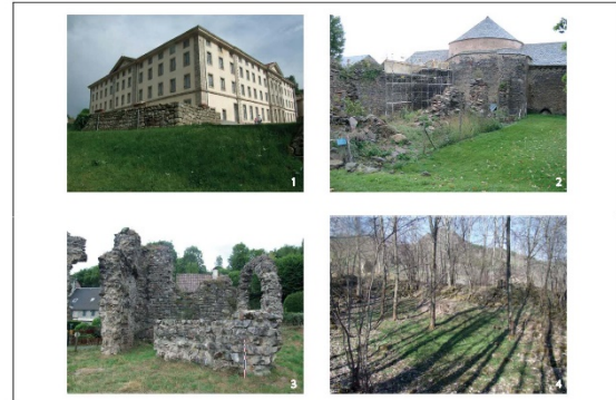
Fig. 2 – Disparité des vestiges d'un site cistercien à l'autre

déplaçant la focale sur l'eau, d'autres canaux d'informations peuvent être empruntés (fig. 2).