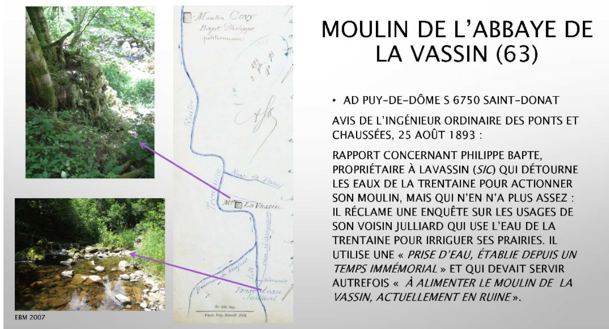
Fig. 6 – Abbaye de La Vassin : avis de l'ingénieur ordinaire des ponts et chaussées, 25 août 1893 Archives départementales du Puy-de-Dôme, S 6750 Saint-Donat