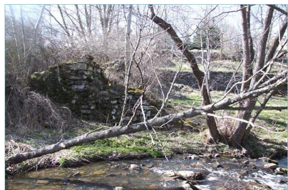
Fig. 4 : Ruine du moulin de l'abbaye de Bellecombe (43).