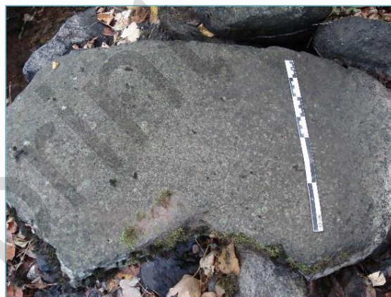
Fig. 5 : Fragment de meule retrouvé dans le lit du ruisseau de Bellecombe (43), en bordure du clos monastique

Ainsi, l'ethnographie, au risque d'interprétations anachroniques, demeure une nécessité méthodologique : l'observation de modestes complexes meuniers des deux siècles derniers, dont les vestiges sont encore intelligibles, permet de comprendre bâtiments et équipements dans leur spécificités architecturales et techniques. Ces références locales autorisent dans une certaine mesure la reconnaissance et la compréhension de vestiges plus anciens, que l'abandon de longue date et la végétation souvent abondante avaient menés à la quasi-destruction et à l'oubli.