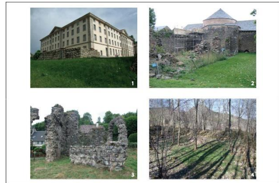
Fig. 2 : Disparité des vestiges d'un site cistercien à l'autre

Puisqu'étant « à côté » du sujet, à l'ouest de la zone d'étude objet du présent séminaire, le choix a été fait de discuter des informations décrivant et expliquant les données acquises durant la recherche. Il s'agit donc d'un discours rétrospectif visant moins les résultats archéologiques et historiques eux-mêmes, que la démarche scientifique, avec toutes ses limites et ses biais. Cette dernière ne peut être livrée qu'a posteriori, qu'après l'expérience de son sujet, car forgée au fil de l'eau, au gré du terrain arpenté et des sources (au propre comme au figuré). Cette expérience naît donc de la contrainte, laquelle est polymorphe. On peut citer en premier lieu, parmi les freins rencontrés, l'indigence des sources manuscrites médiévales des séries H consultées dans leur intégralité pour chacune des abbayes du corpus, mais aussi la disparité de conservation des vestiges d'un site à l'autre. Ceci dit, en déplaçant la focale sur l'eau, d'autres canaux d'informations peuvent être empruntés (fig. 2).