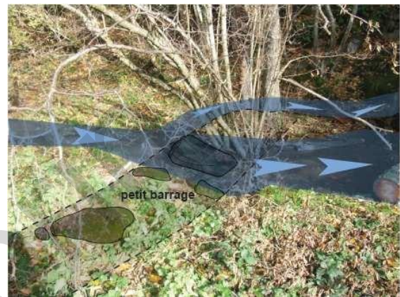
Fig. 3 : Petits aménagements de cours d'eau : dérivation pour le bie f d'un moulin, site de l'abbaye de Mègemont (63)

Alors, un changement d'échelle peut s'opérer et il est possible de s'attacher plus longuement à certains vestiges plus prégnants et spécialisés que d'autres, qui semblent appartenir à un système fonctionnellement relié au site monastique. Les moulins seront les plus faciles à repérer et à qualifier encore qu'en fonction de leur état de conservation, souvent médiocre, il sera difficile d'en déterminer la fonction (à farine, à huile, à foulon, à tan, scies hydrauliques, marteaux hydraulique). (fig. 4)