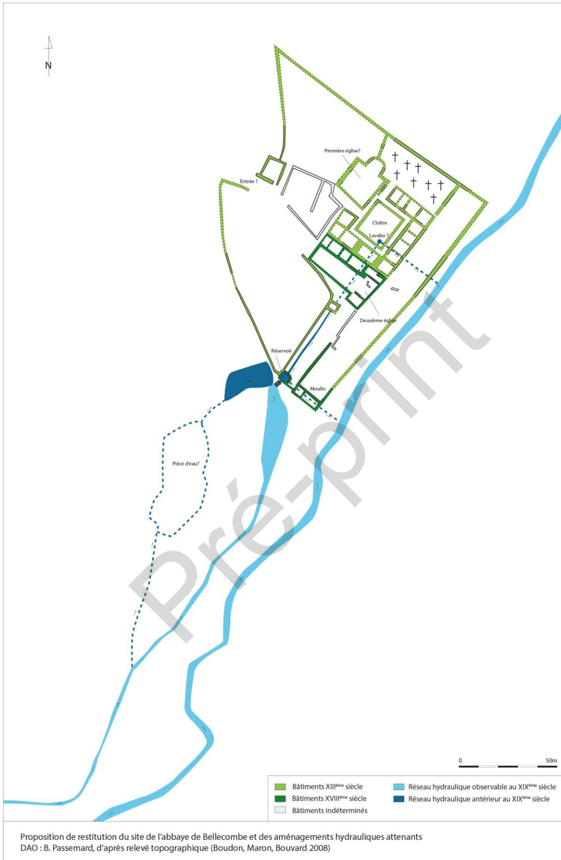
Fig. 7 : Restitution topographique du complexe conventuel de l'abbaye de Bellecombe (Moyen Âge et époque moderne)