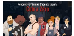
Sensibilisation au handicap invisible