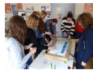
Évaluations centrées utilisateurs