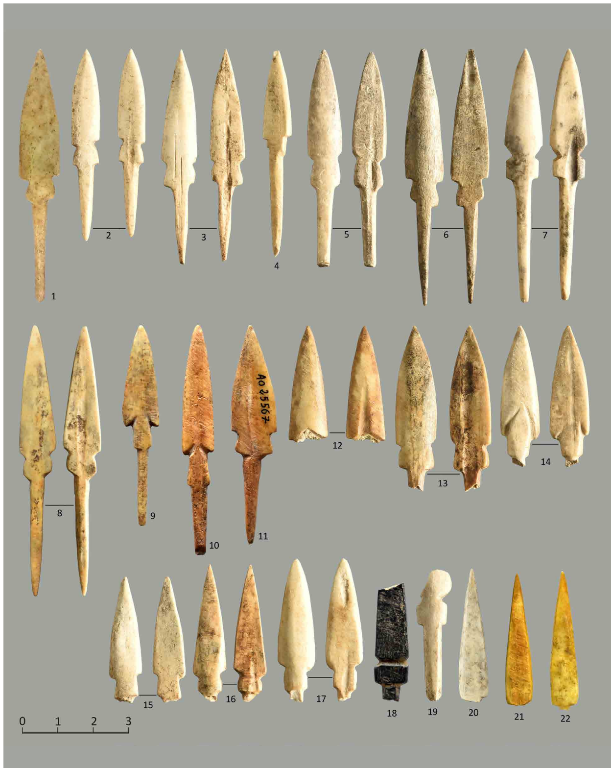
Fig. 1: Bone arrowheads with a leaf-shaped blade from Ziwiye; These samples are housed in The Metropolitan Museum of Art (No. 1; ©The Metropolitan Museum of Art, Photo by: Narges Bayani), Sanandaj Museum (Nos. 2 to 8, 12 to 20; ©The Sanandaj Museum, photo by: Nima Fakoorzadeh and Neda Tehrani), Musée du Louvre / Antiquités Orientales Department (Nos. 9 to 11; ©Musée du Louvre, photo by: Yousef Hassanzadeh), National Museum of Iran (Nos. 21 to 22, ©National Museum of Iran, Photo by: Yousef Hassanzadeh).