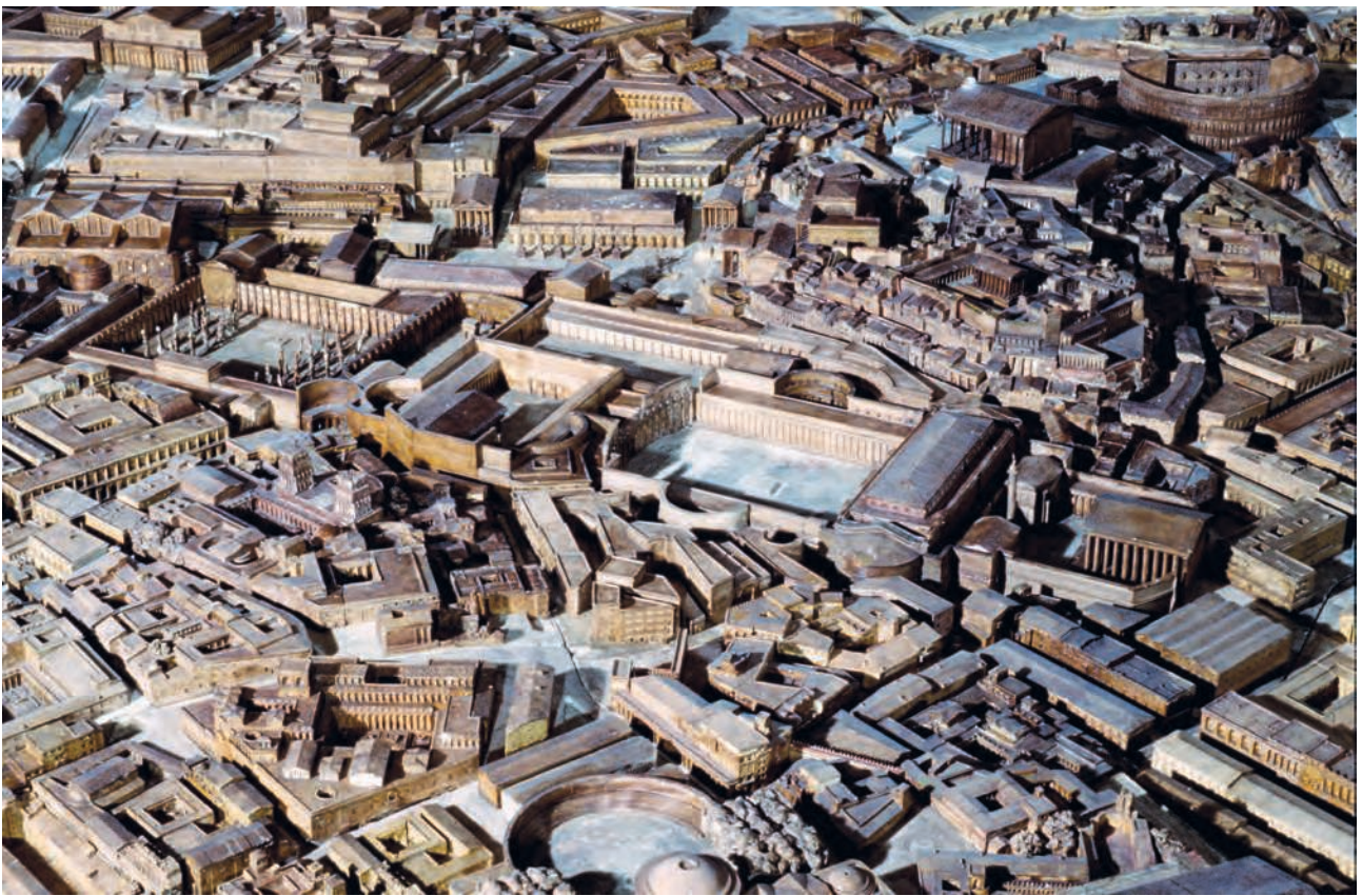
Fig. 6 – Les forums impériaux sur la maquette de P. Bigot (Université de Caen Normandie – France) (Université de Caen Normandie, CIREVE, Plan de Rome).

Les fouilles commencées en 2005 dans les caves du Palazzo Valentini, face à la colonne Trajane, ont en effet mis en évidence, à la cote 15,25 m a.s.l., soit légèrement au-dessous du niveau de la grande place du forum (16,30 m environ a.s.l.), une puissante plate-