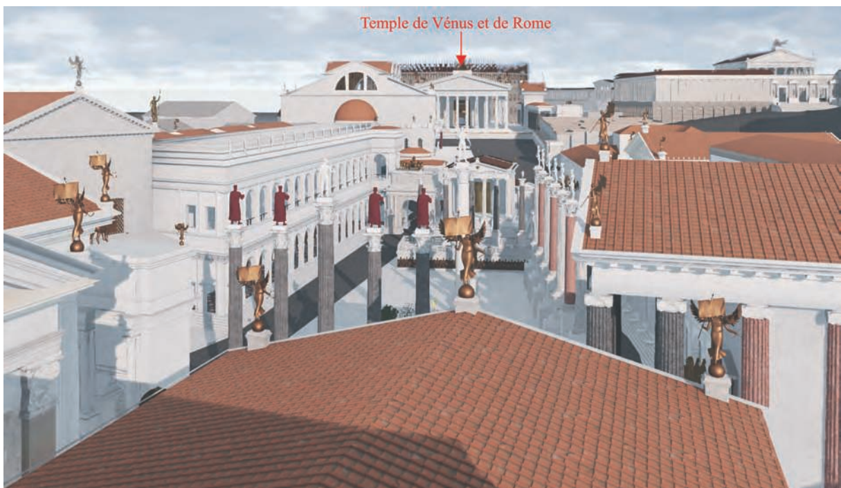
Fig. 5 – Vue sur le temple de Vénus et Rome depuis la terrasse supposée du temple à Vénus Victrix sur le Capitole (solstice d'été – fin de l'après-midi) (Université de Caen Normandie, CIREVE, Plan de Rome).

deuxième cas d'étude. L'existence de ce temple est assurée par des sources textuelles incontestables 21 . Mais, dès le haut Moyen Âge, on perd