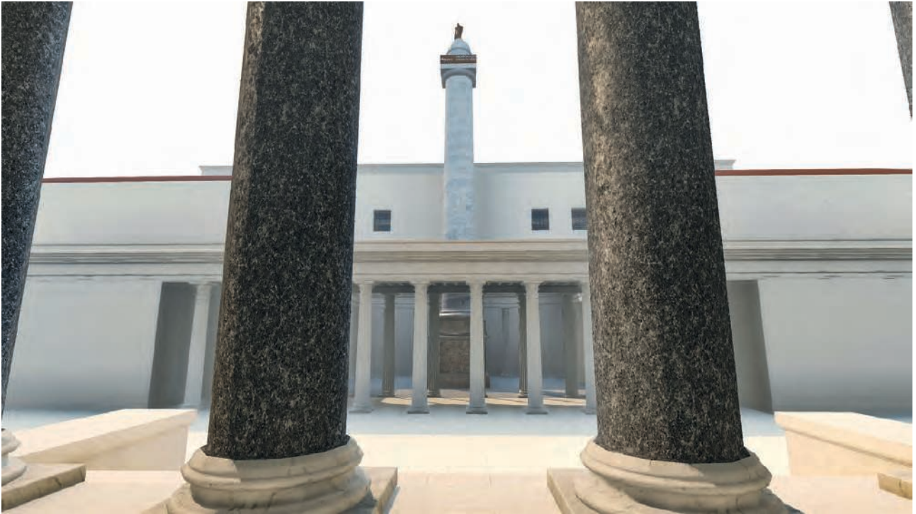
Fig. 9 – La colonne Trajane depuis le pronaos supposé du temple à Trajan et Plotine (solstice d'été – milieu de la matinée) (Université de Caen Normandie, CIREVE, Plan de Rome).

le lien exprimé dans les Régionnaires entre la colonne et le temple – templum diui Traiani ET columnam – est conforté par la présence d'un pronaos de temple surélevé, construit dans l'axe de l'ensemble du Forum 30 . Reste la question de l'arc parthique, que nous n'avons pas encore placé dans la restitution. Si l'on admet en même temps l'hypothèse d'Eugenio La Rocca et de Roberto Meneghini qui le situe au nord de la colonne et l'hypothèse d'un temple sur podium tel que nous l'avons représenté, alors il ne faudrait pas imaginer un arc aux dimensions trop imposantes, qui masquerait de façon exagérée la vue de la colonne depuis le podium du temple. Le portique de fermeture nord de la cour de la colonne que nous avons représenté (fig. 9) est un « maximum » admissible pour qu'un lien visuel réel existe entre le temple et la colonne. Peut-être même que ce portique avait été supprimé lors de la construction du temple, puisque des traces d'arasement sont nettement visibles au niveau