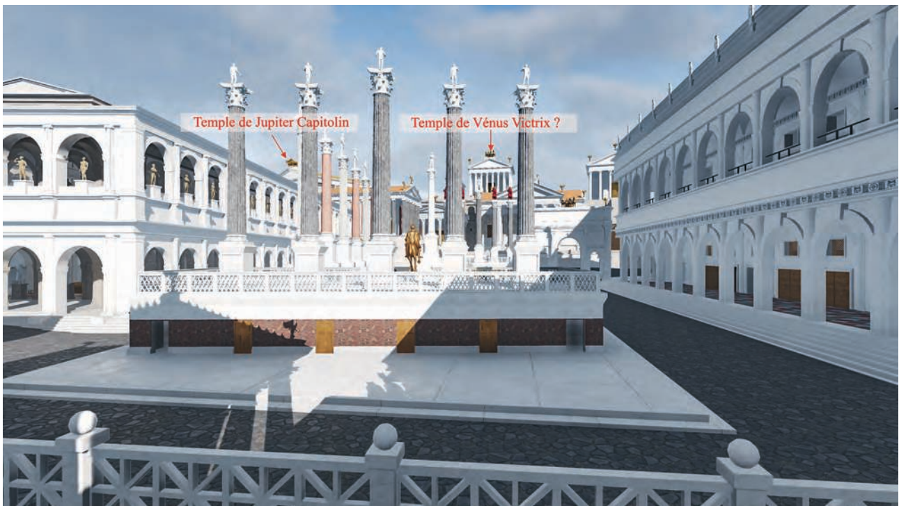
Fig. 3 – Vue du Capitole depuis le podium du temple au divin César (solstice d’été – début de la matinée) (Université de Caen Normandie, CIREVE, Plan de Rome).