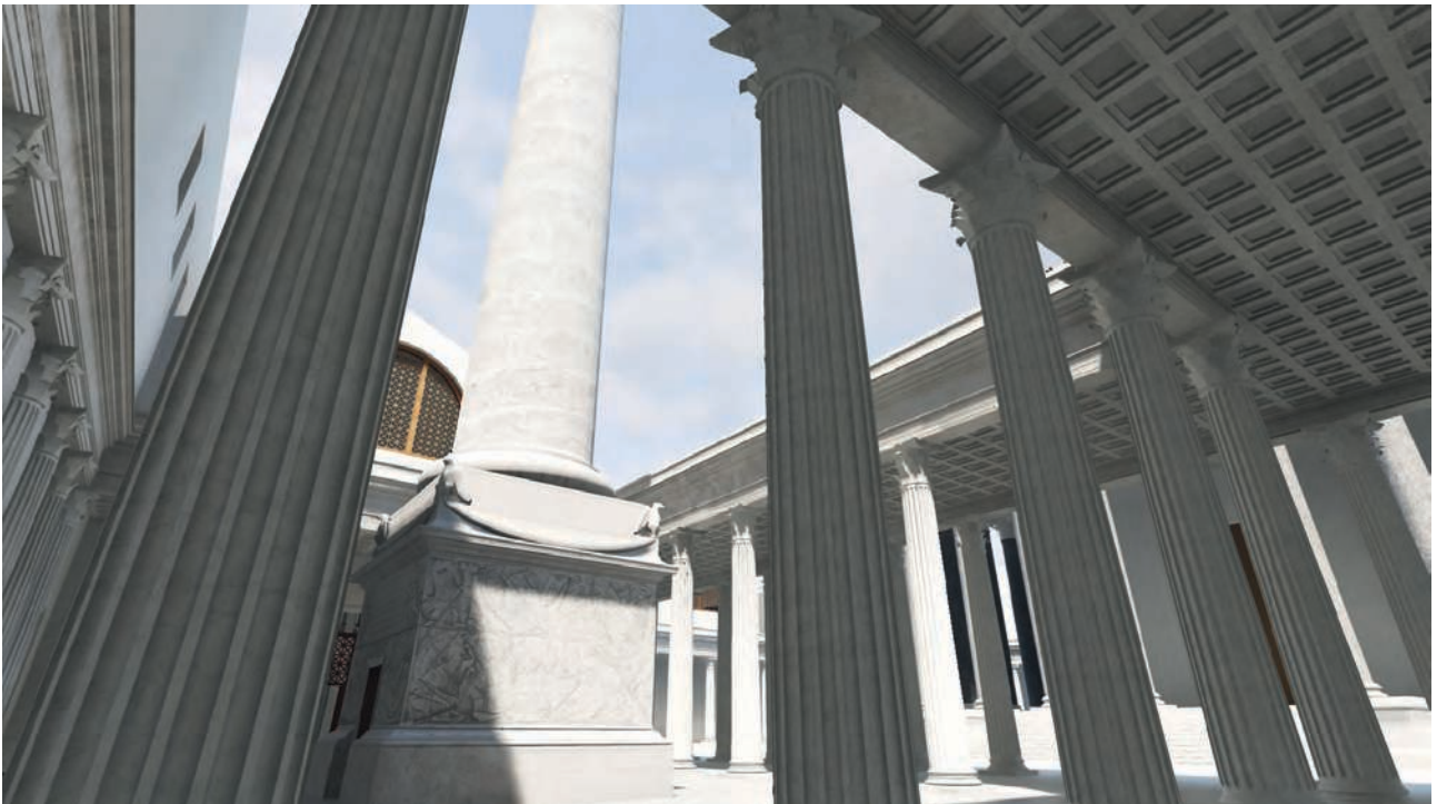
Fig. 8 – La cour de la colonne Trajane et le temple de Trajan au fond à droite (solstice d’été – milieu de la matinée) (Université de Caen Normandie, CIREVE, Plan de Rome).

n’est naturellement pas une preuve de l’exactitude de la restitution dans son ensemble : le temple pourrait être plus petit. Il pourrait être