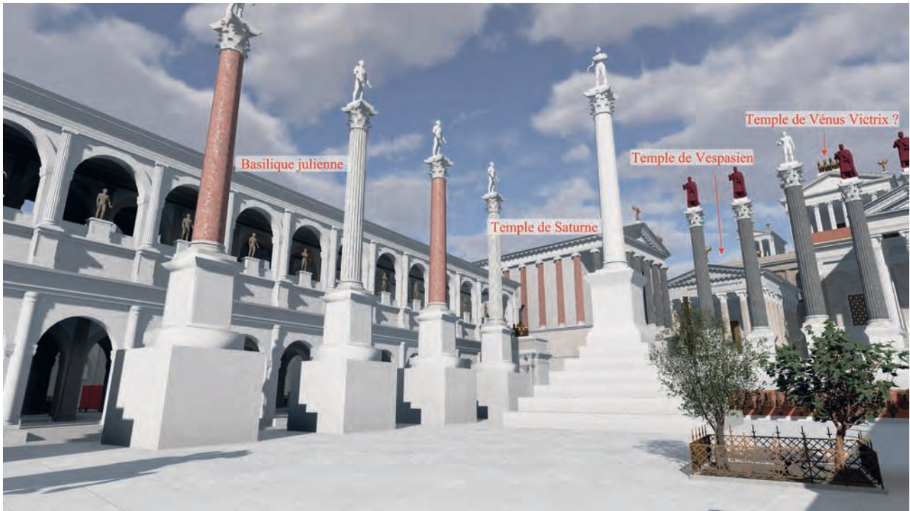
Fig. 2 – Vue du Capitole depuis l’enclos sacré du figuier, de l’olivier et de la vigne (solstice d’été – début de la matinée) (Université de Caen Normandie, CIREVE, Plan de Rome).