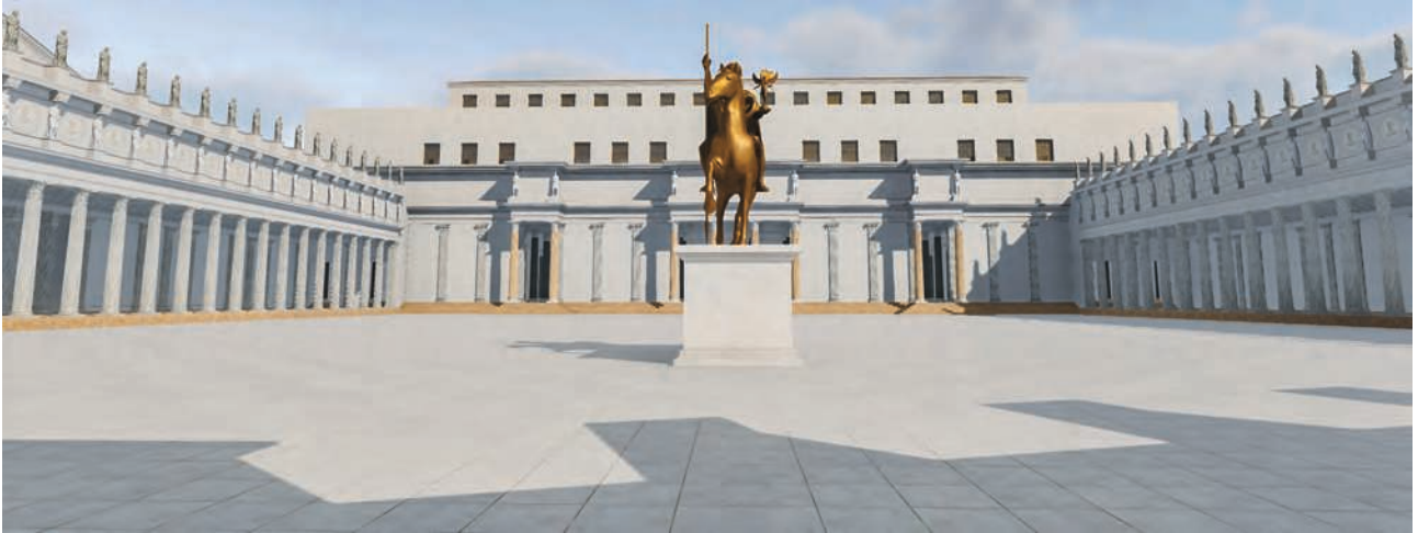
Fig. 7 – La grande place du Forum de Trajan depuis son extrémité sud-est (solstice d’été – début de la matinée) (Université de Caen Normandie, CIREVE, Plan de Rome).