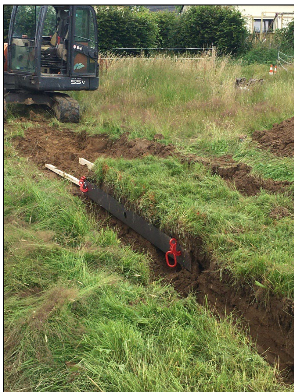
Figure 3 : Photo du prélèvement de la terre végétale dans un champ (IS)

La terre végétale a été prélevée dans un champ à 20 km du site de l'étude. Afin de ne pas détériorer la structure de la terre végétale, des outils métalliques ont été confectionnés à l'image d'une « pelle à pizza ».