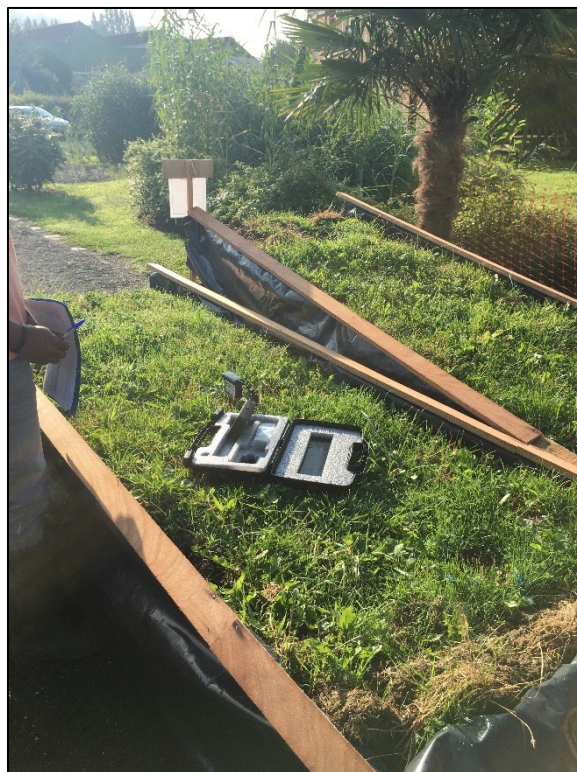
Figure 2 : Photo des bacs de terre végétale mis en œuvre pour les mesures quotidiennes (IS)